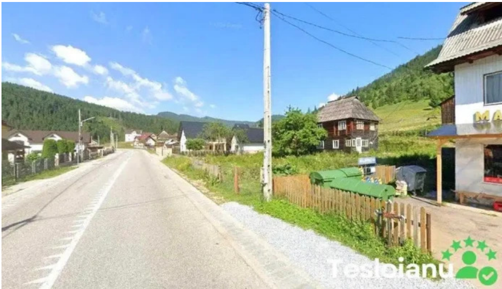
La trei chi?toace carlibaba