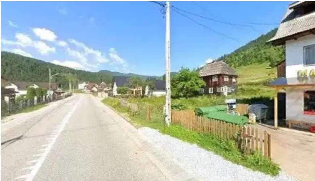
La trei chistoace unde