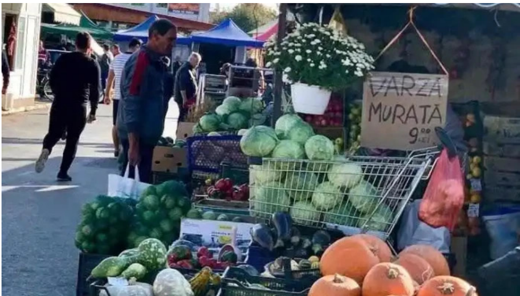
Pia?a agroalimentar? br?ne?ti br?ne?ti