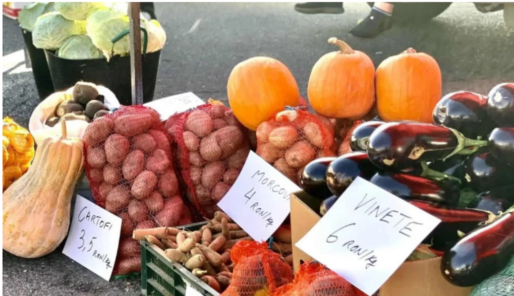
Piata agroalimentara branesti comentarii