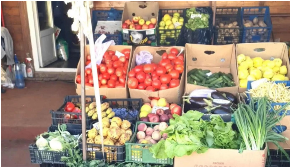
Piata agroalimentara branesti promo?ie