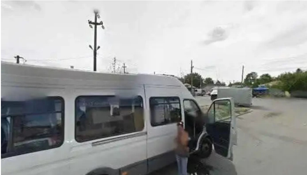
Piata agroalimentara branesti street view si 360deg