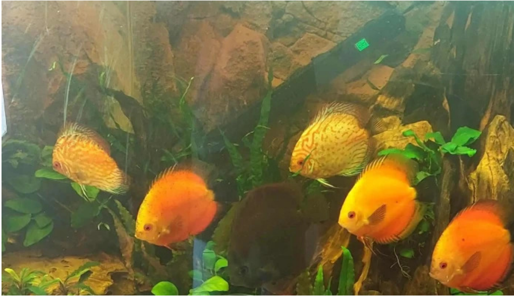
Piata agroalimentara branesti pre?uri