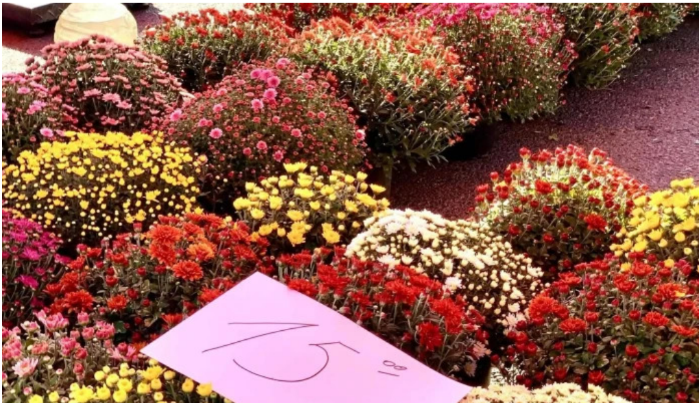
Piata agroalimentara branesti deschis acum