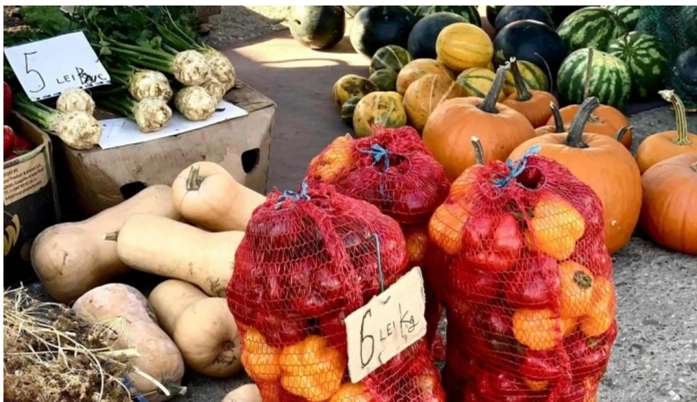
Piata agroalimentara branesti aproape de mine