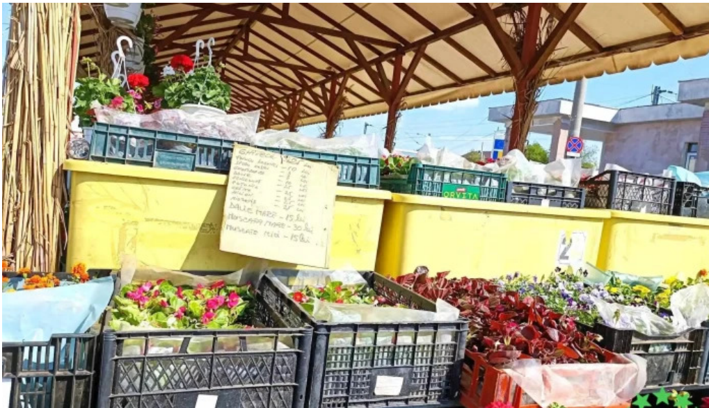
Piata agroalimentara branesti interior