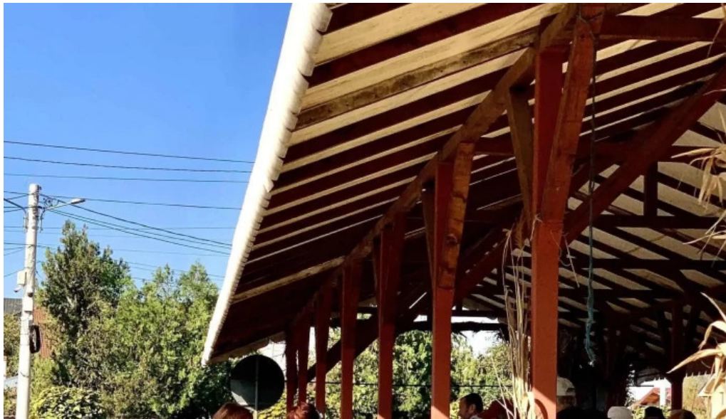
Piata agroalimentara branesti br?ne?ti