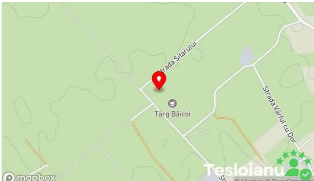
Targul baicoi hart?