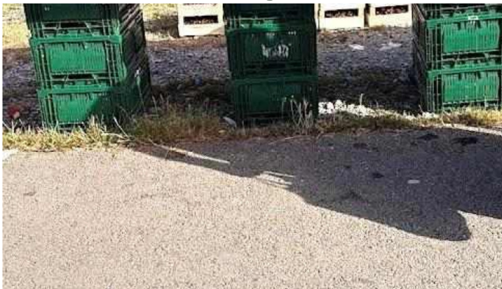
Targul b?icoi b?icoi