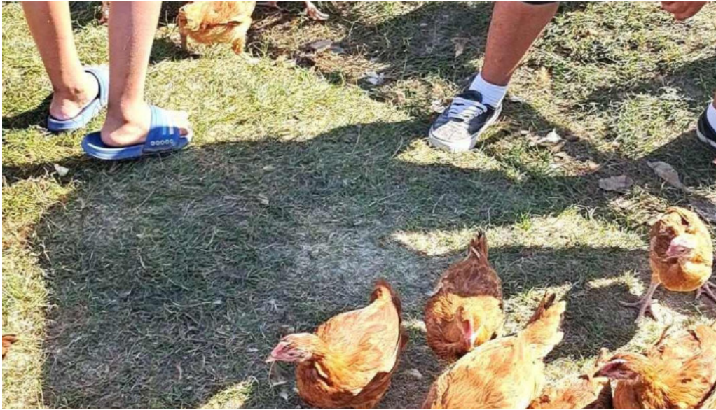
Targul baicoi videoclipuri