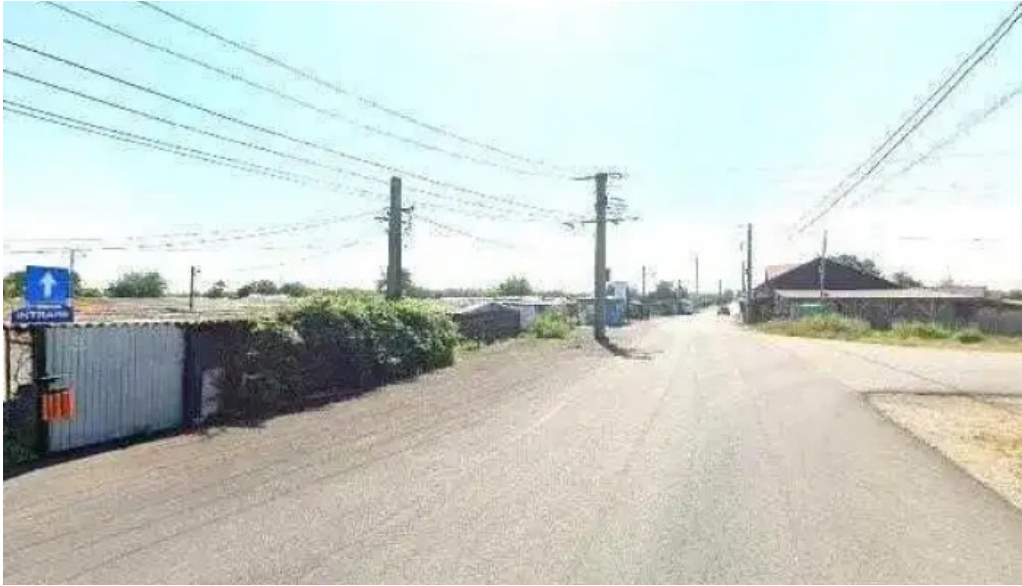
Targul baicoi street view si 360deg