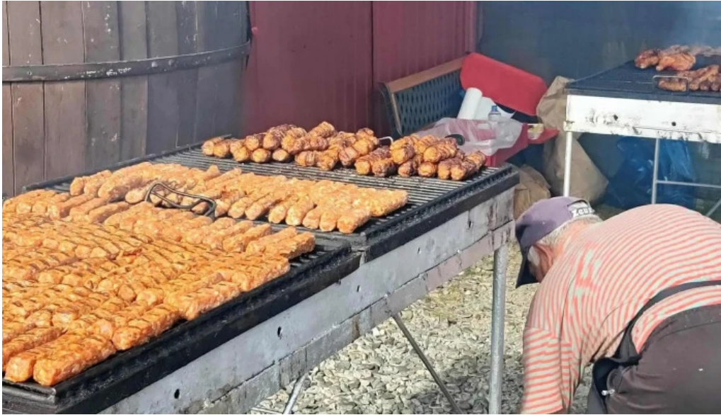
Targul baicoi num?r