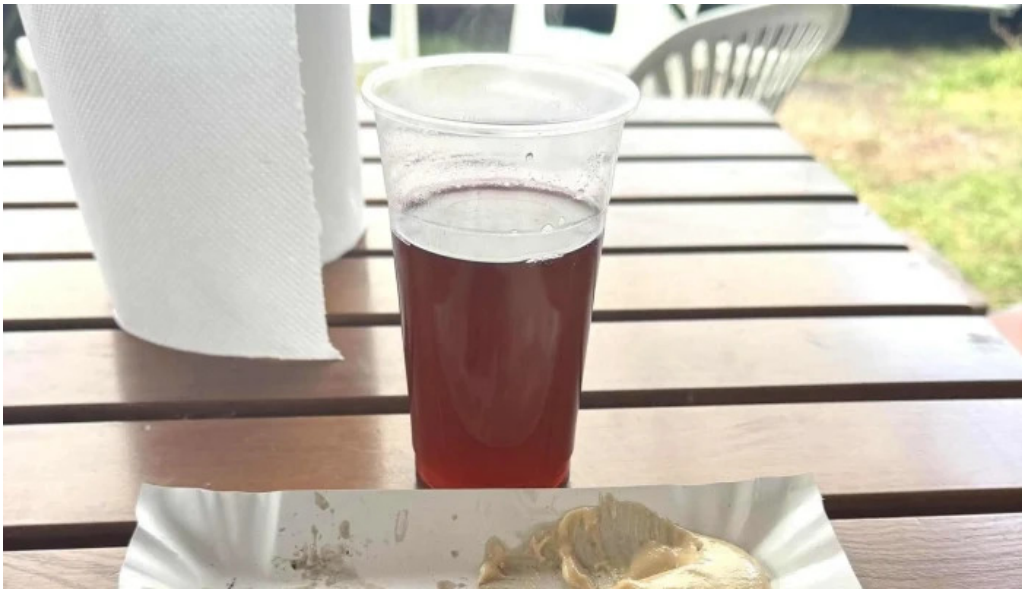
Targul baicoi telefon