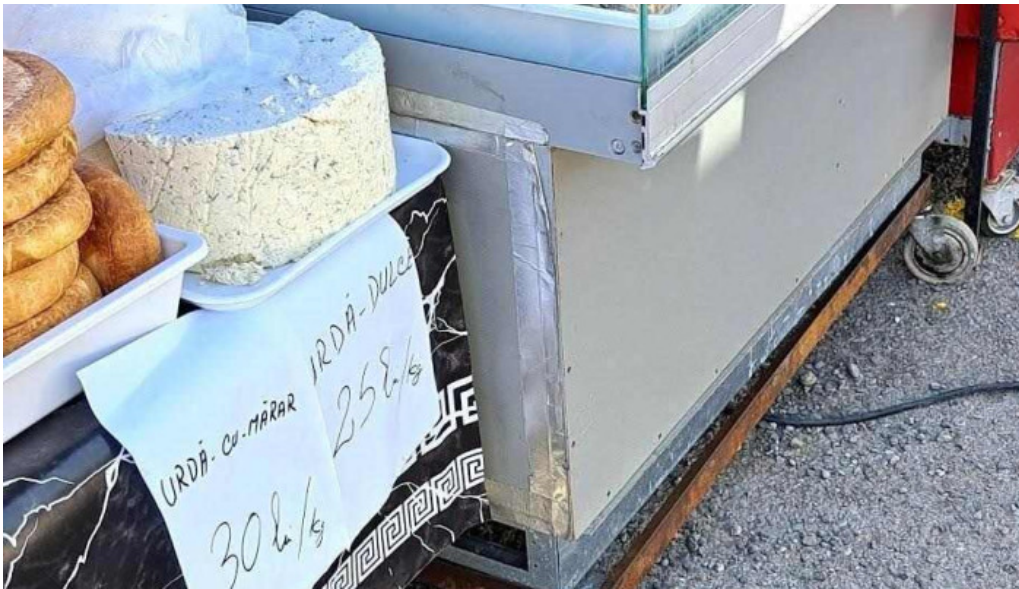
Targul baicoi interior