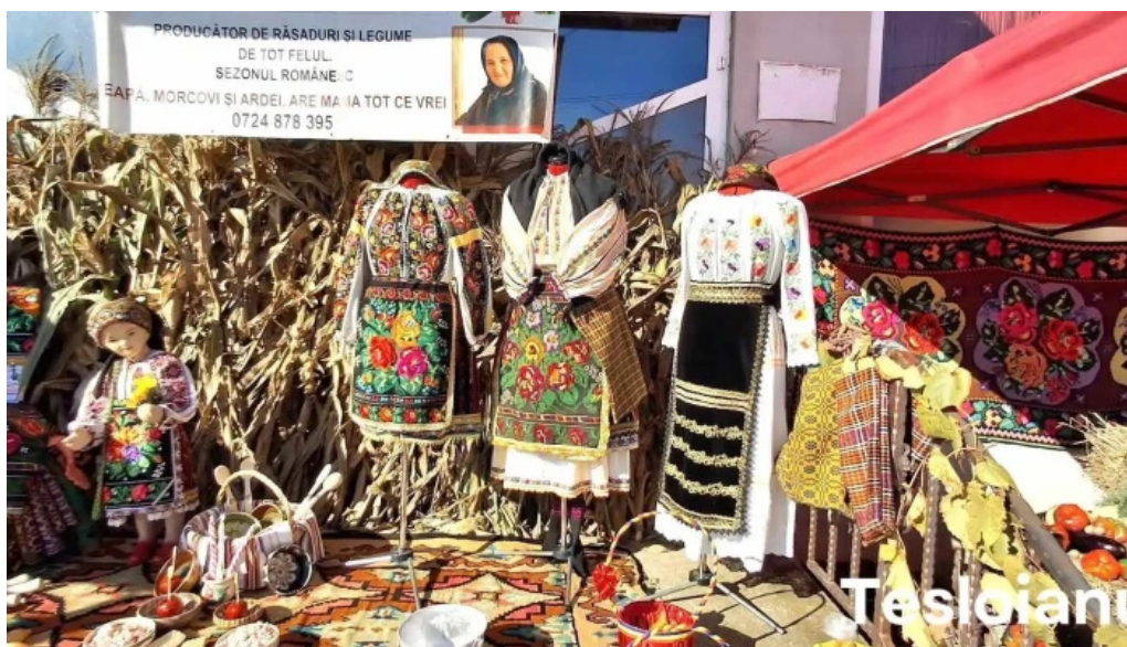
Targul saptamanal reduceri