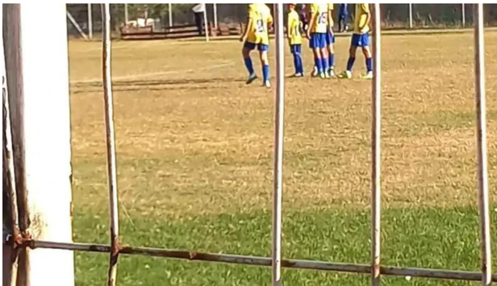
Targul saptamanal videoclipuri