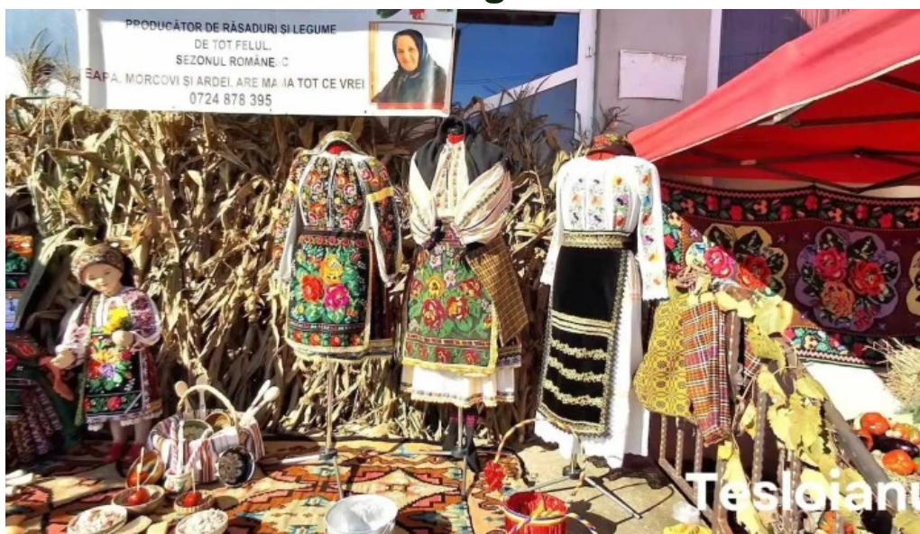
Targul saptamanal beleni sarbi