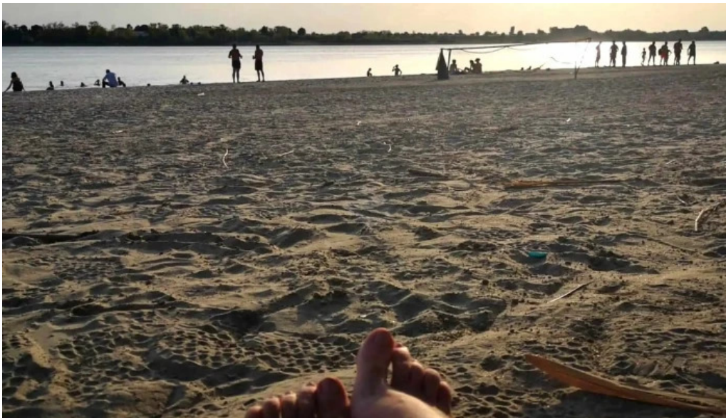
Plaja cetate loca?ie