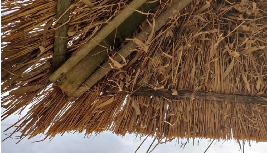
Plaja cetate videoclipuri