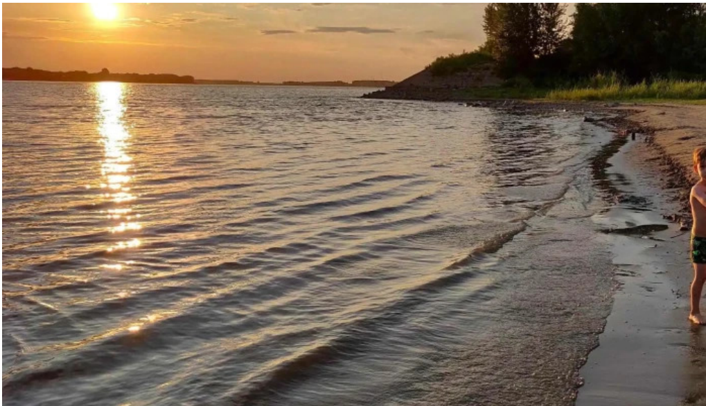
Plaja cetate cum s? ajungi acolo