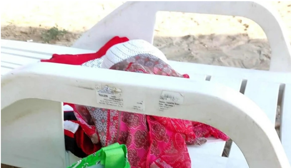
Plaja cetate unde