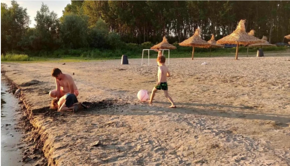
Plaja cetate reduceri