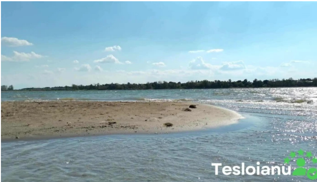
Plaja cetate plaja