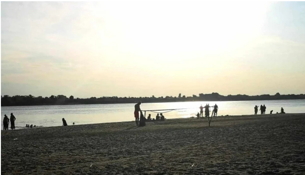
Plaja cetate romania