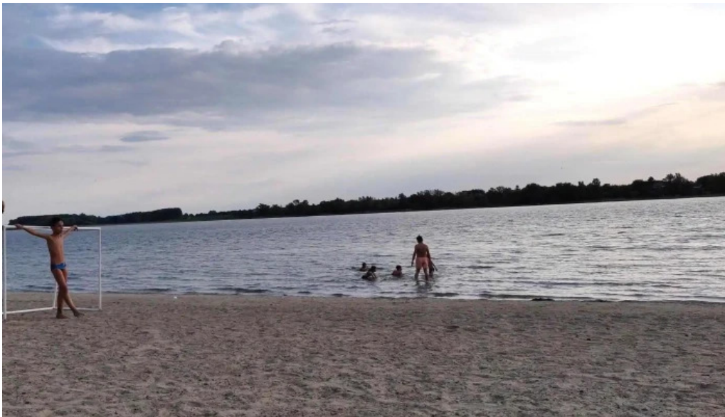
Plaja cetate aproape de mine