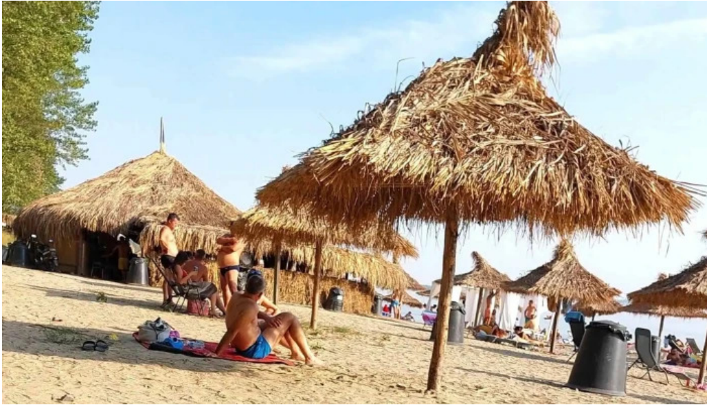
Plaja cetate telefon