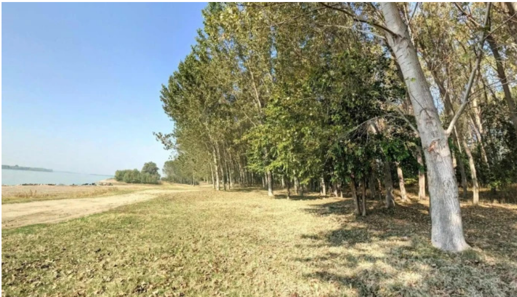
Plaja cetate street view si 360deg