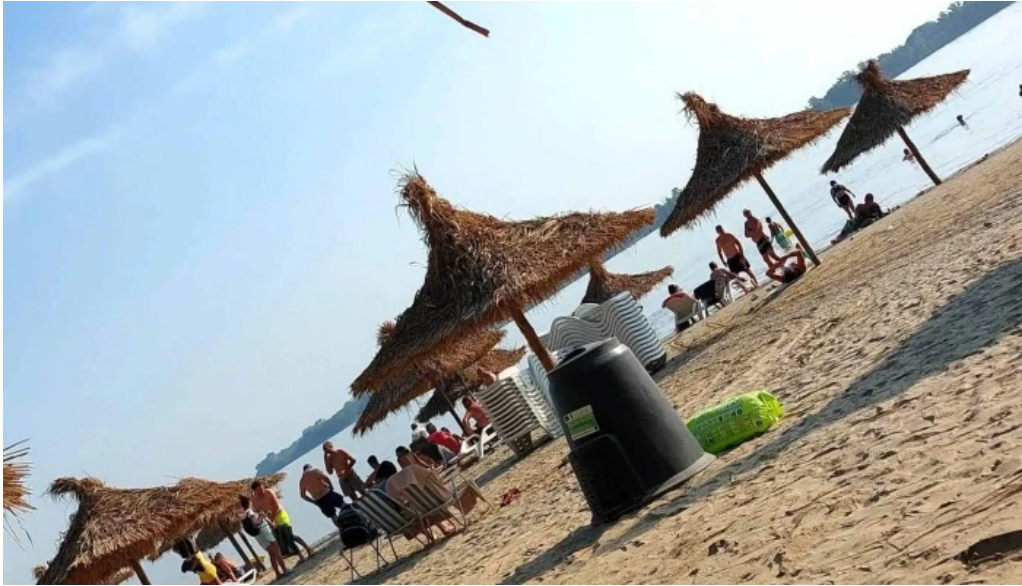
Plaja cetate scor