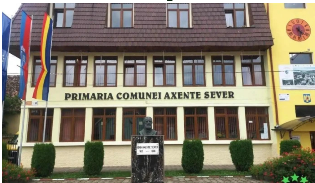
Prim?ria axente sever axente sever