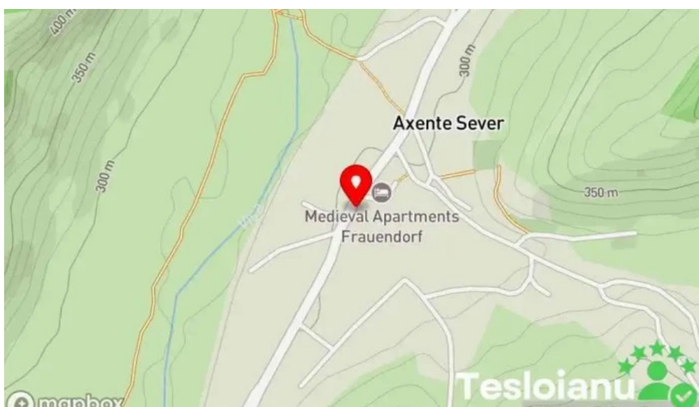
Primaria axente sever hart?