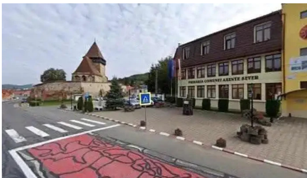
Primaria axente sever street view si 360deg