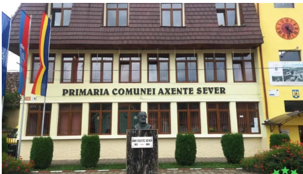
Primaria axente sever reduceri