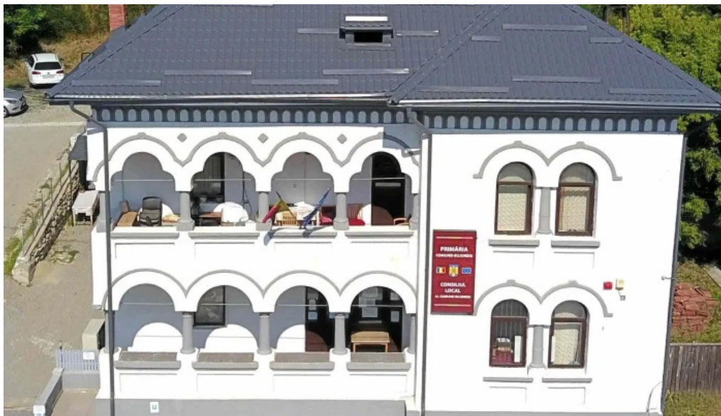
Uat comuna bujoreni de la proprietar