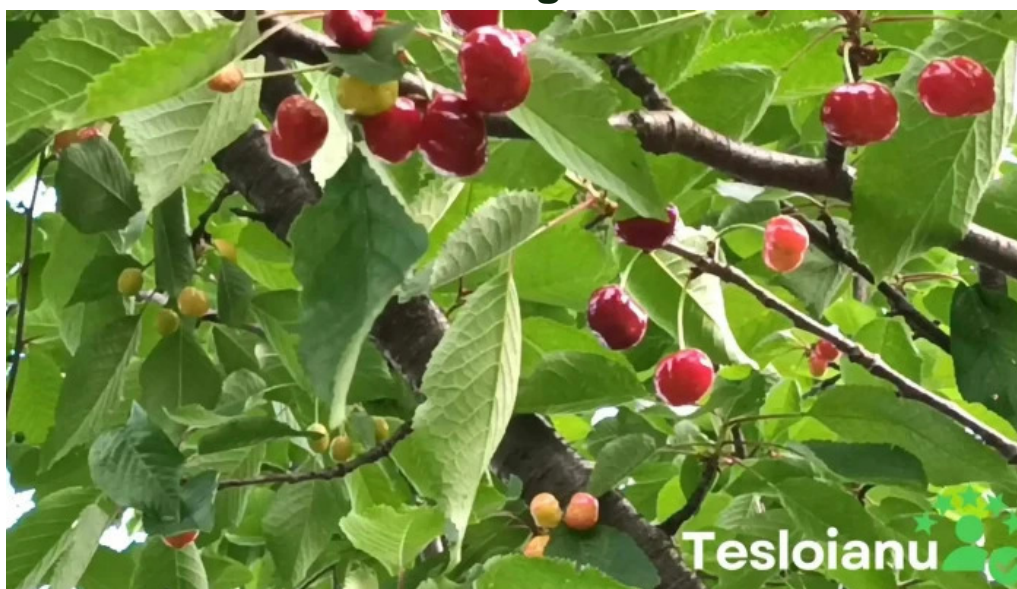
Uat comuna bujoreni videoclipuri