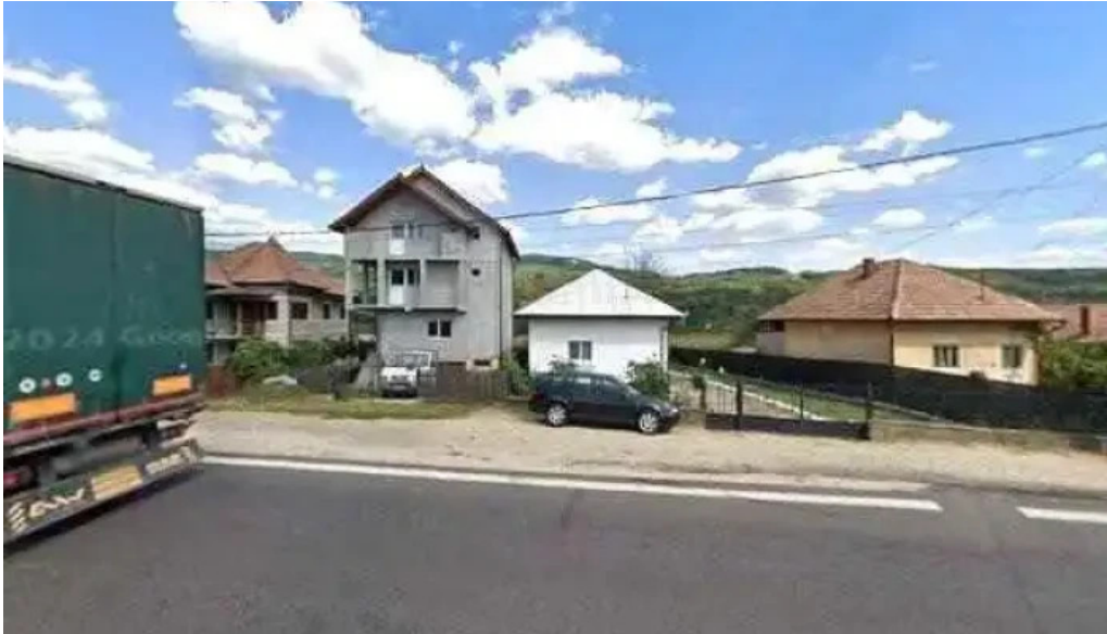
Uat comuna bujoreni street view si 360deg