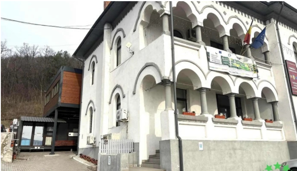
Uat comuna bujoreni program