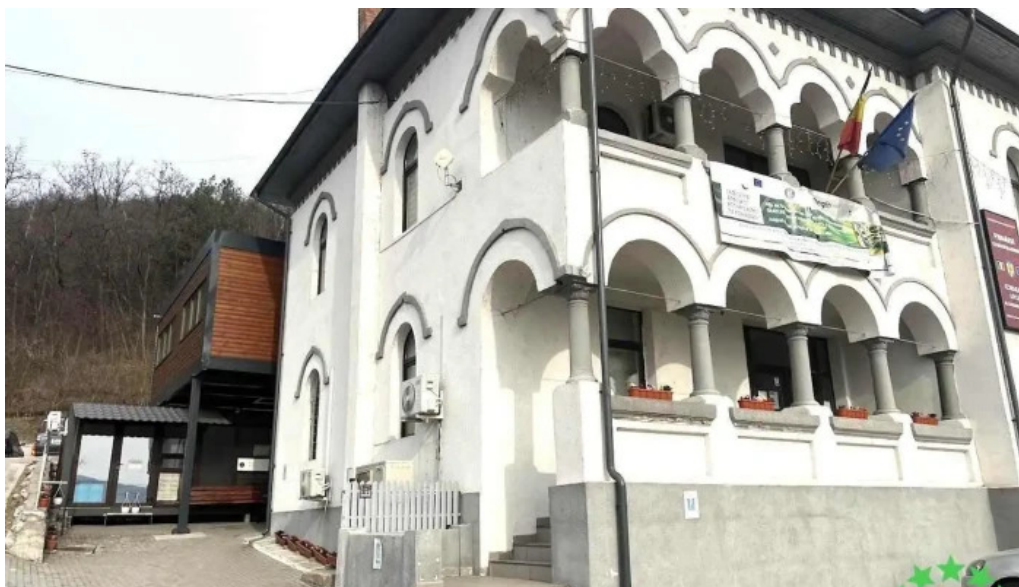
Uat comuna Bujoreni Bujoreni