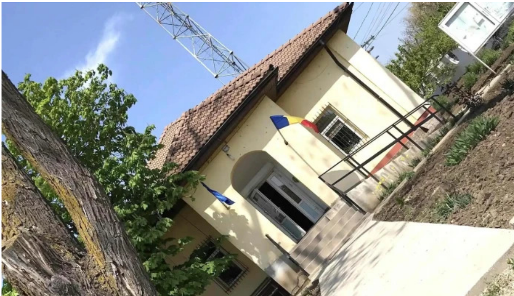
Primaria cioroiasi fotografii