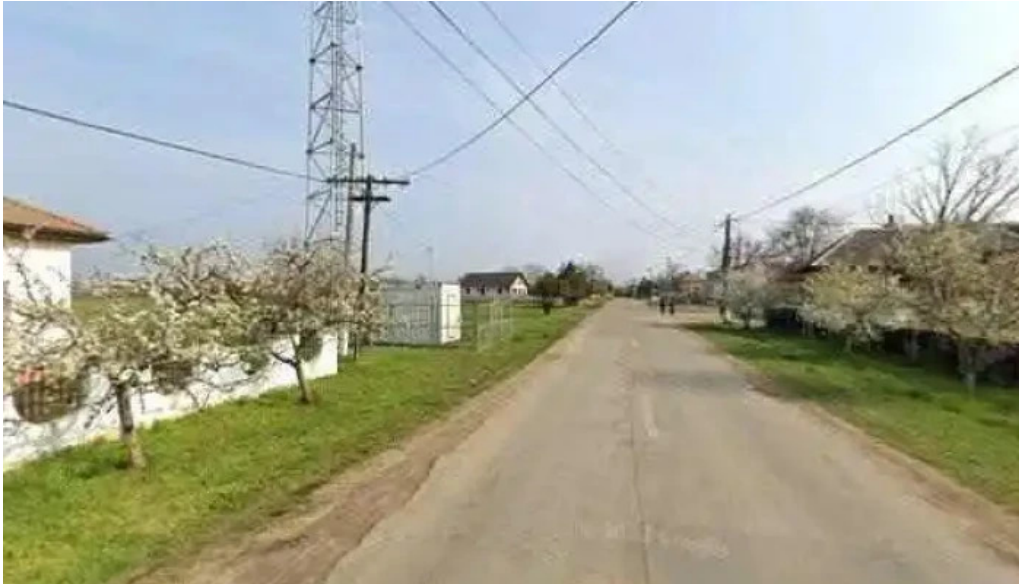
Primaria cioroiasi street view si 360deg