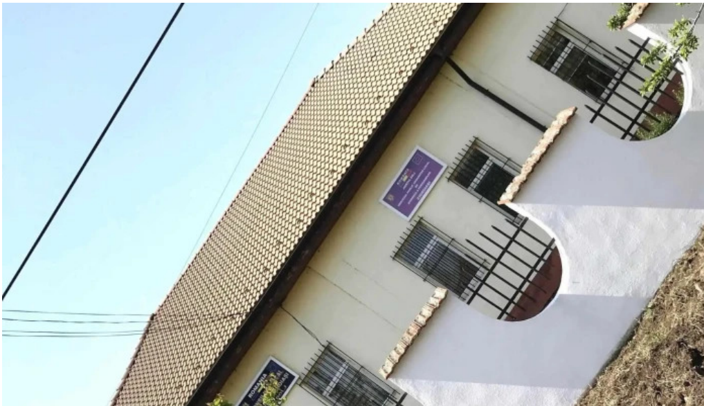
Primaria cioroiasi cioroia?i