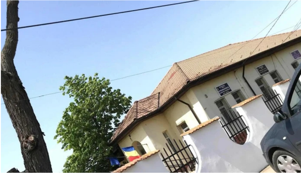
Primaria cioroiasi pre?uri