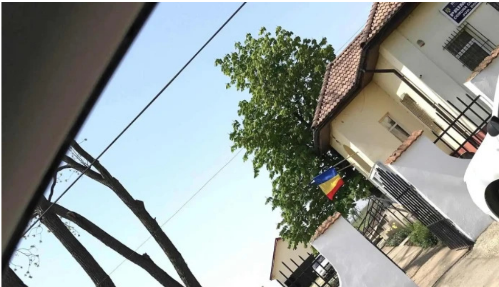
Primaria cioroiasi reduceri