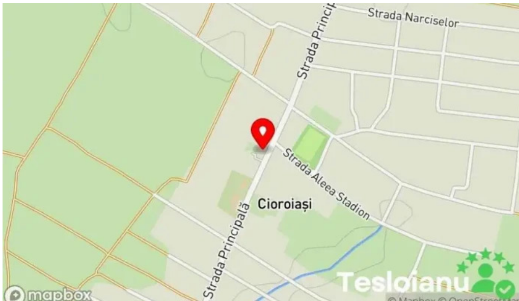
Primaria cioroiasi hart?