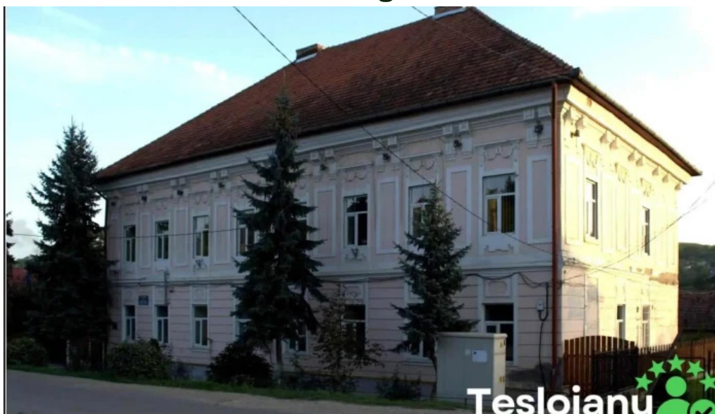
Prim?ria cojocna cojocna