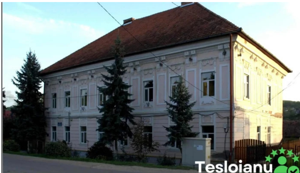
Primaria cojocna aproape de mine