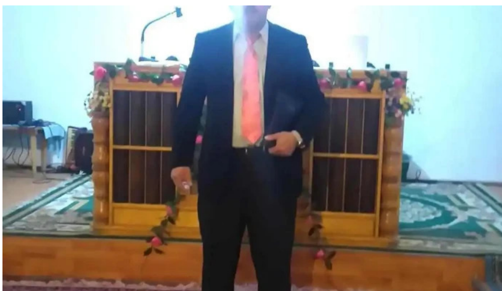
Primaria comlosu mare fotografii