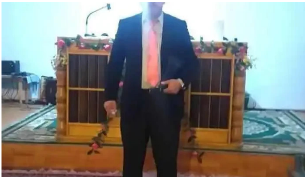
Primăria comloșu mare comloșu mare