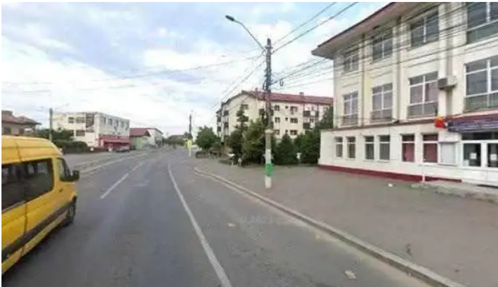
Primaria cornetu street view si 360deg