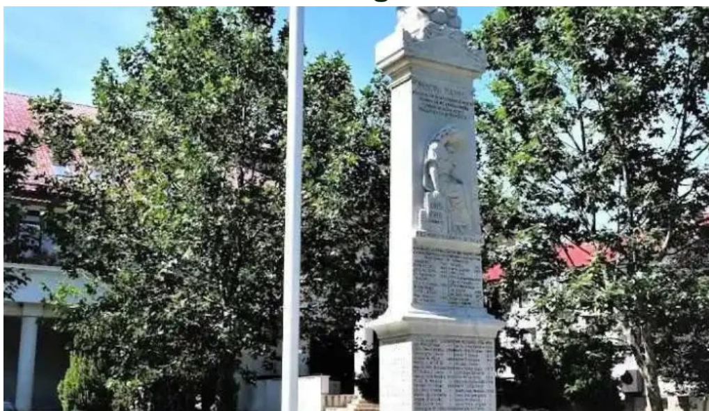
Prim?ria cornetu cornetu