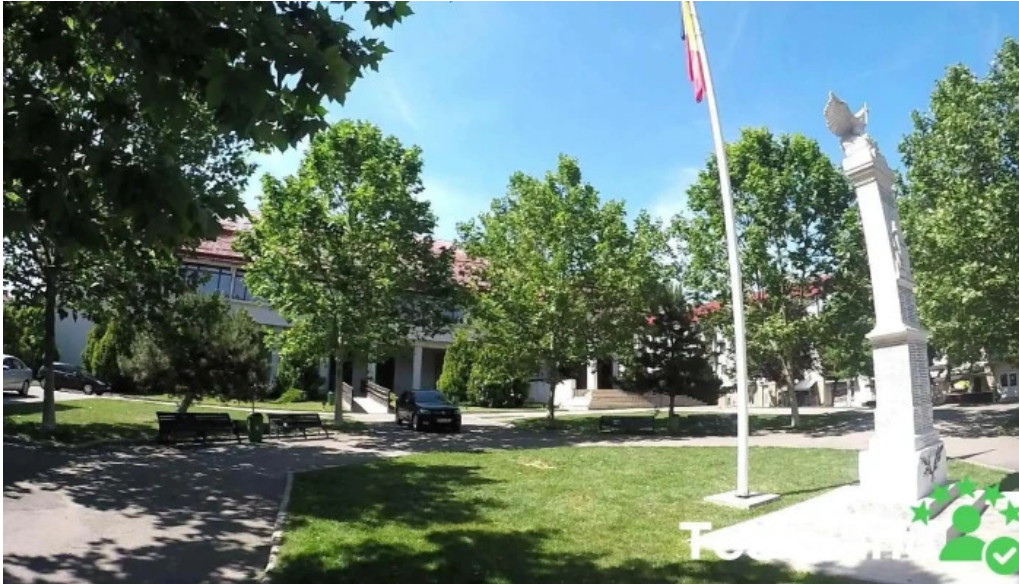
Primaria cornetu videoclipuri