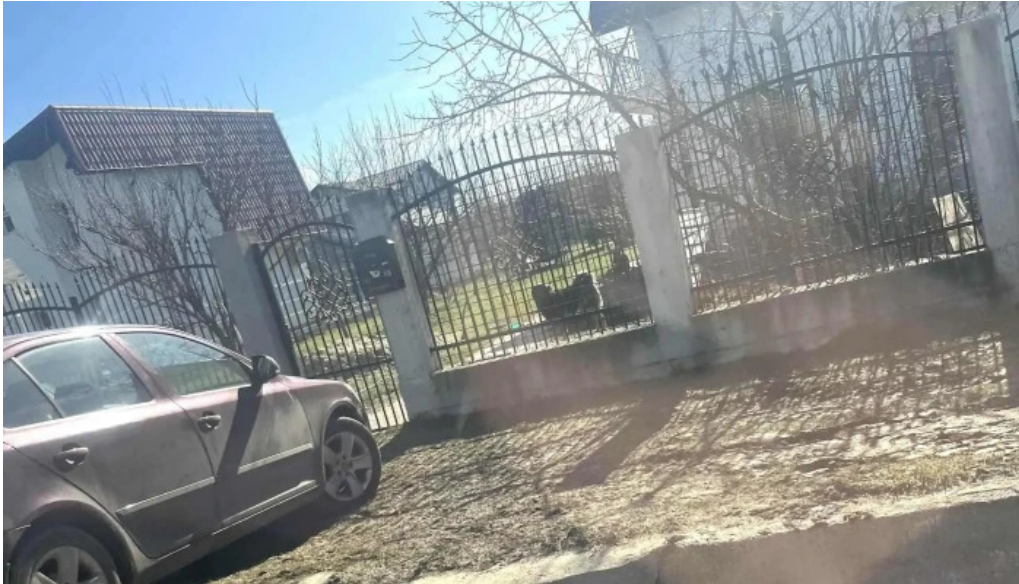
Primaria cornetu cornetu