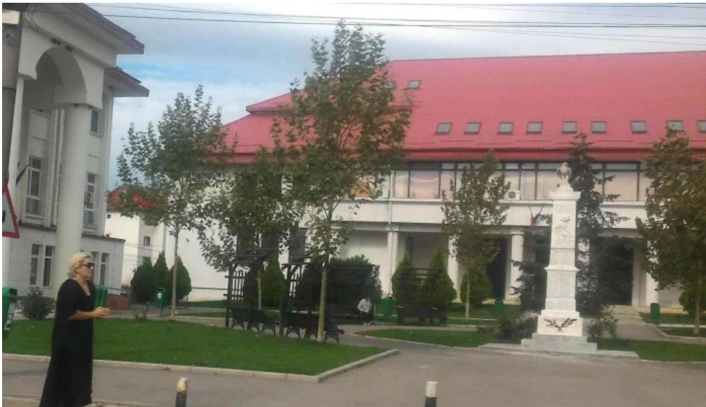
Primaria cornetu cum s? ajungi acolo