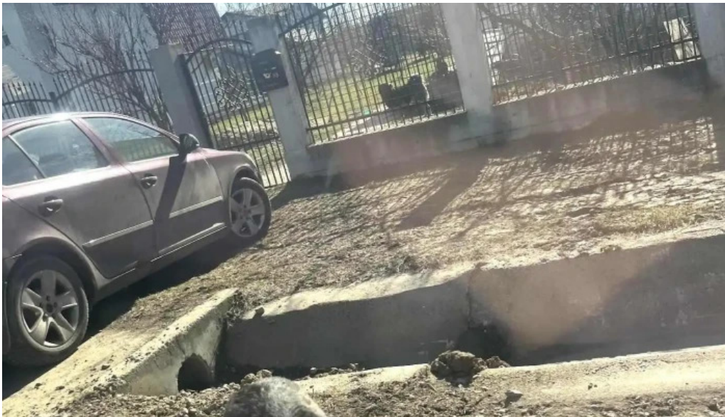
Primaria cornetu cele mai recente