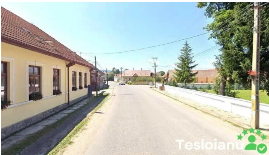
Prim?ria sansimion sansimion