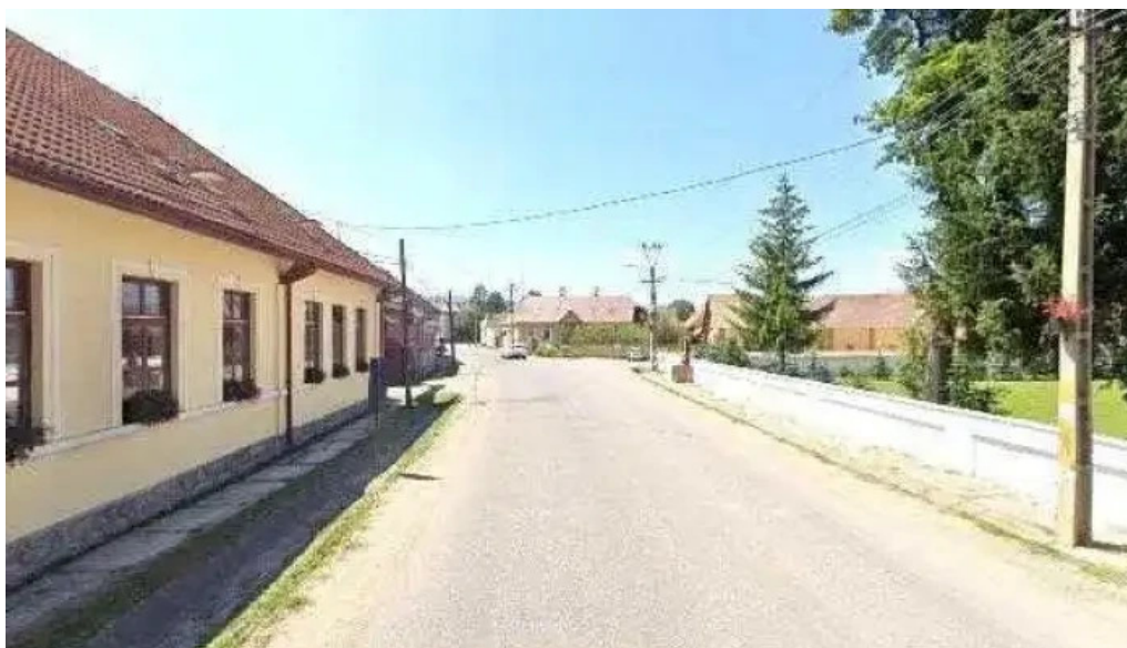
Primaria sansimion adres?