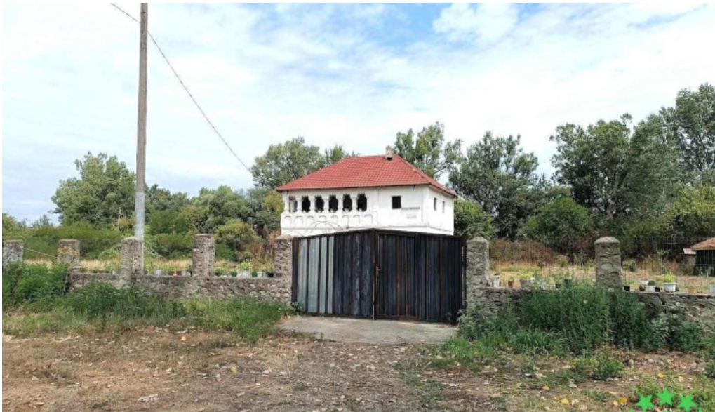
Cula cu?ui bro?teni