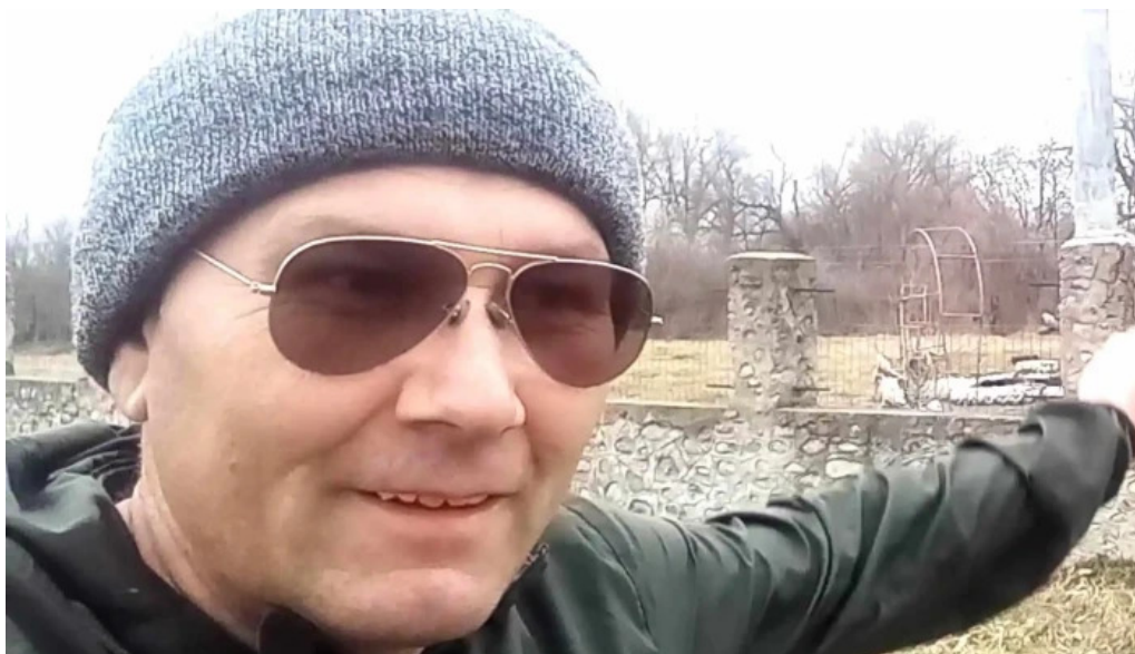
Cula cutui bro?teni