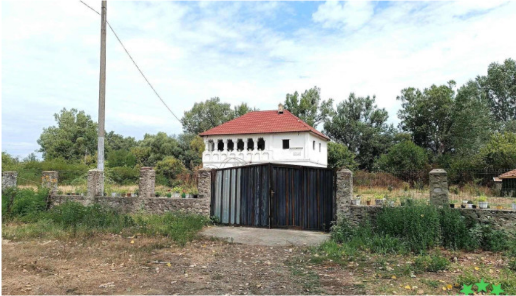
Cula cutui promo?ie