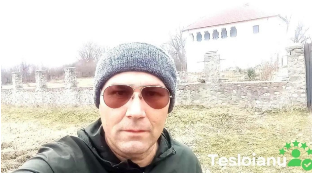
Cula cutui videoclipuri