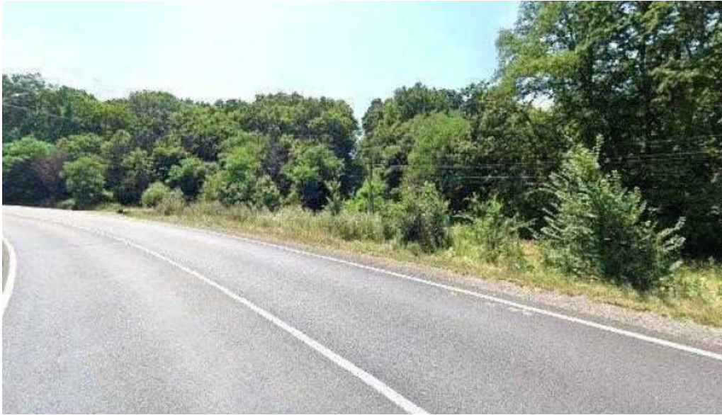
Castrul roman de la albota recenzii