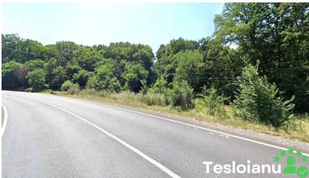
Castrul roman de la albota albota