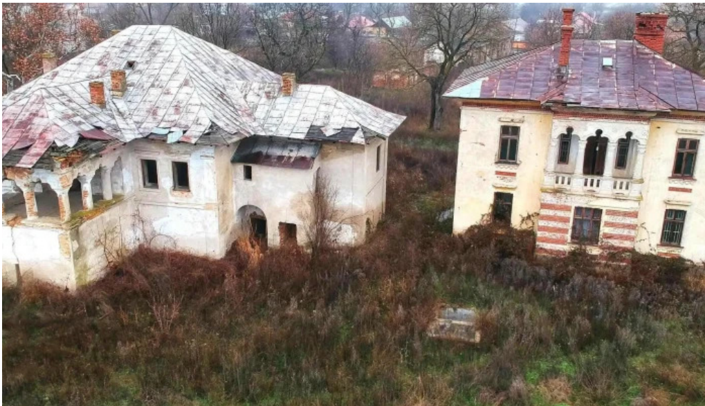
Conacul cotofenilor co?ofenii din fa??