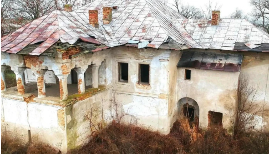
Conacul cotofenilor scor