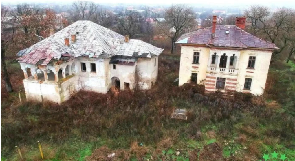
Conacul co?ofenilor co?ofenii din fa??