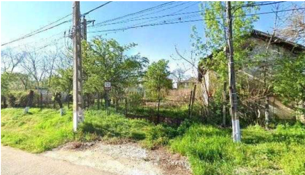
Conacul cotofenilor street view si 360deg