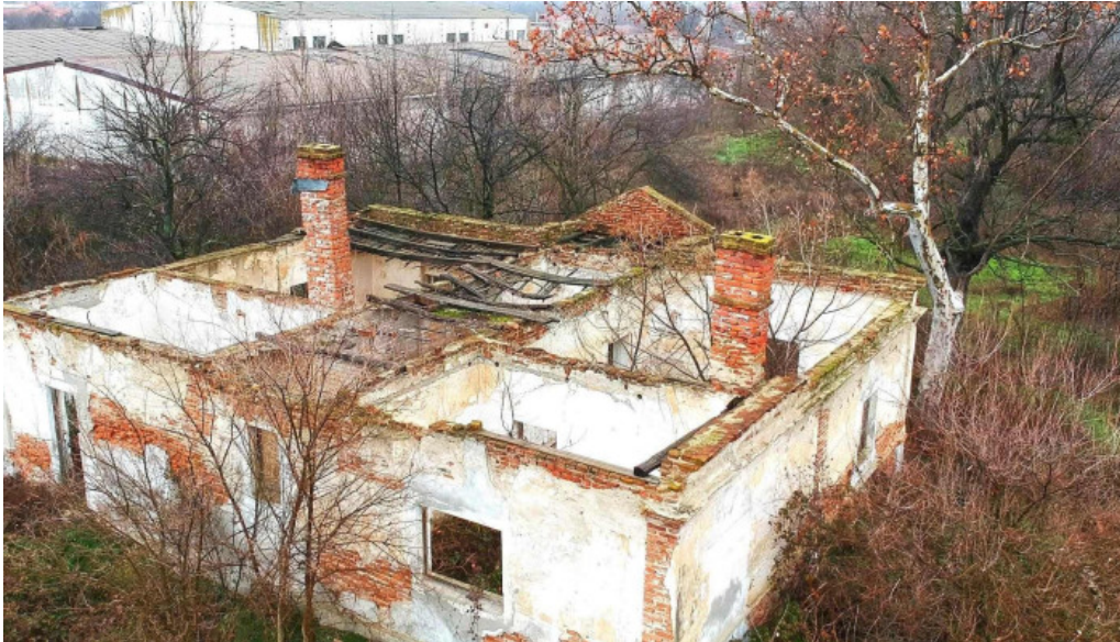
Conacul cotofenilor catalog