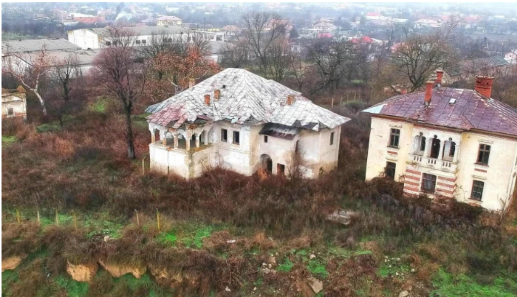
Conacul cotofenilor num?r