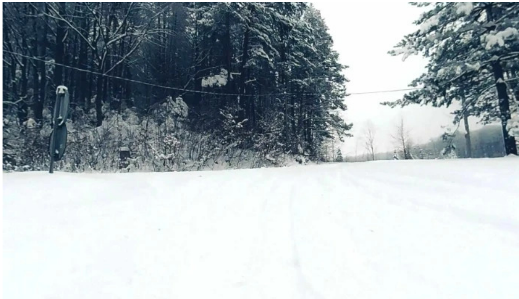
Monument ciprian porumbescu street view si 360deg