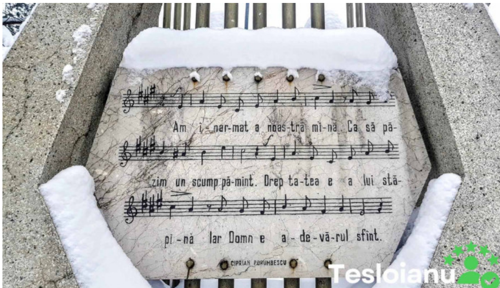
Monument ciprian porumbescu pre?uri