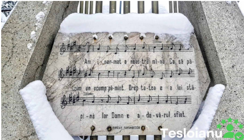
Monument ciprian porumbescu dj178g