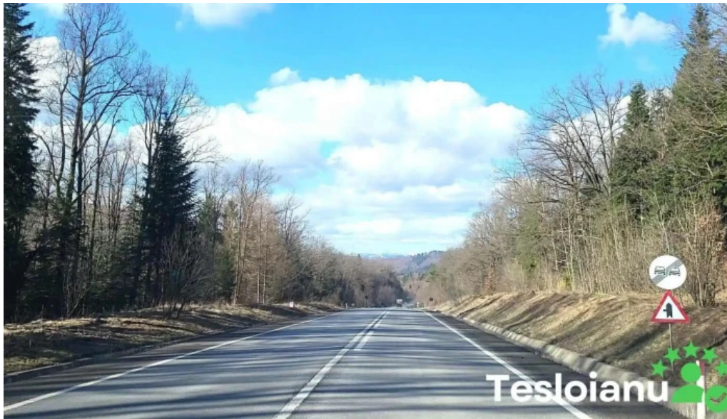
Monument ciprian porumbescu videoclipuri