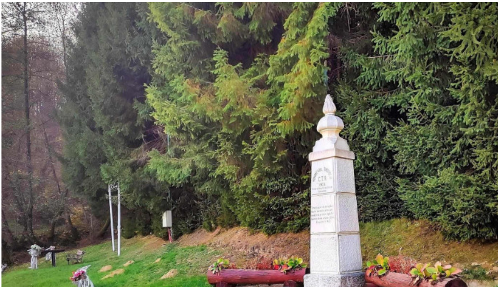
Monumentul turismului loca?ie