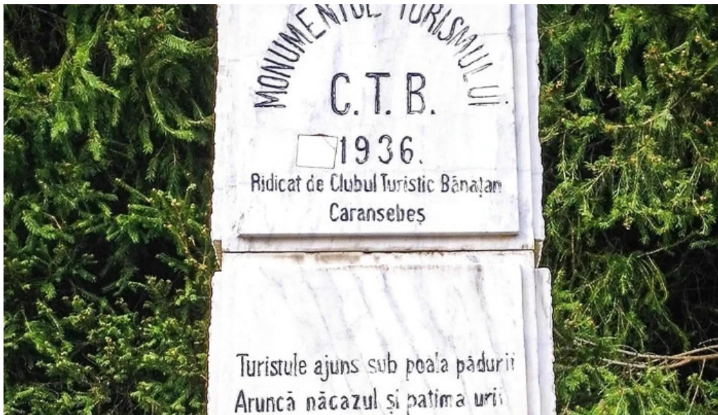
Monumentul turismului num?