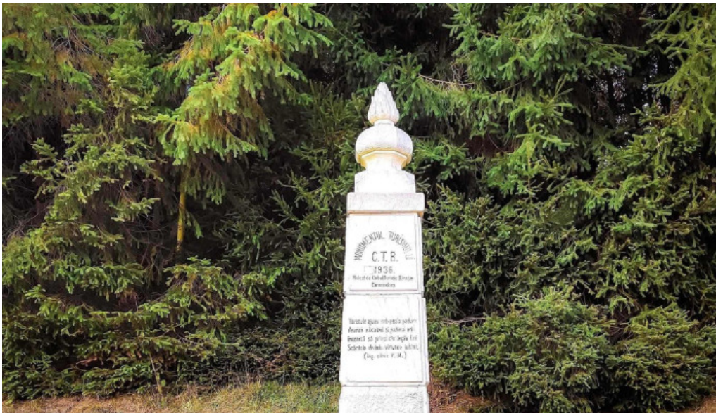
Monumentul turismului fotografii