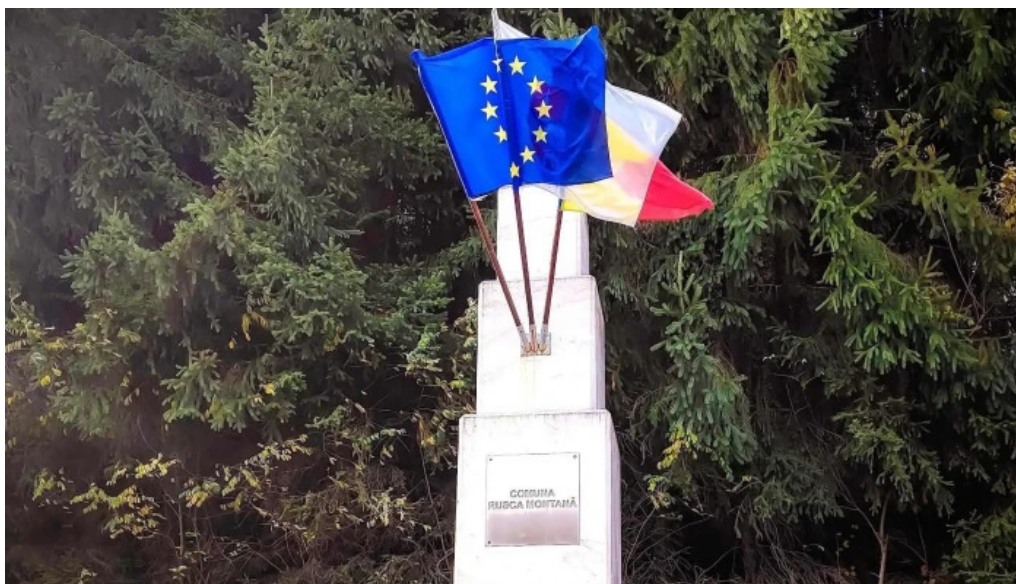
Monumentul turismului rusca montan?