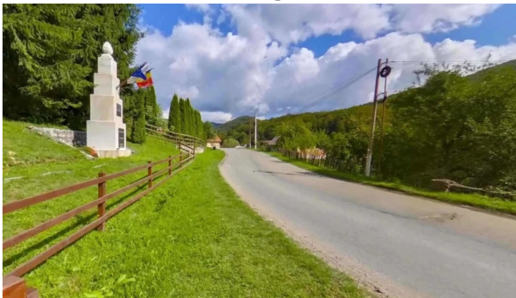
Monumentul turismului street view si 360deg