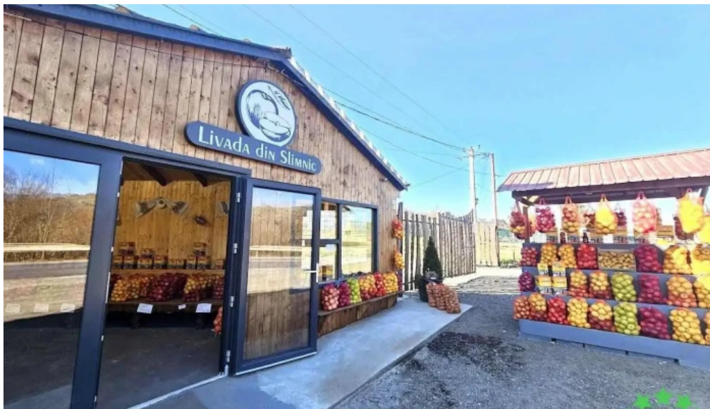
Livada din slimnic dn14