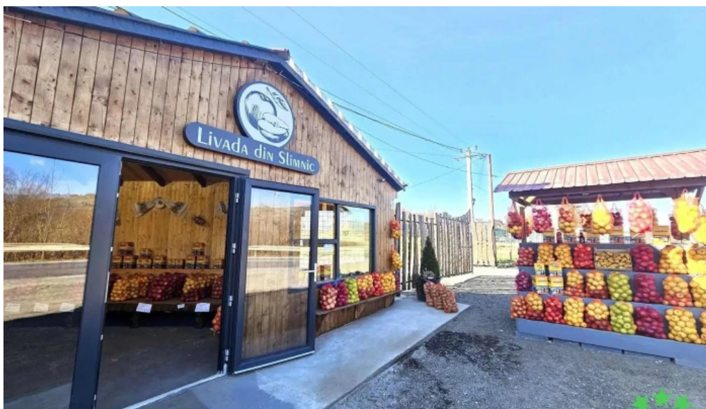
Livada din slimnic recenzii