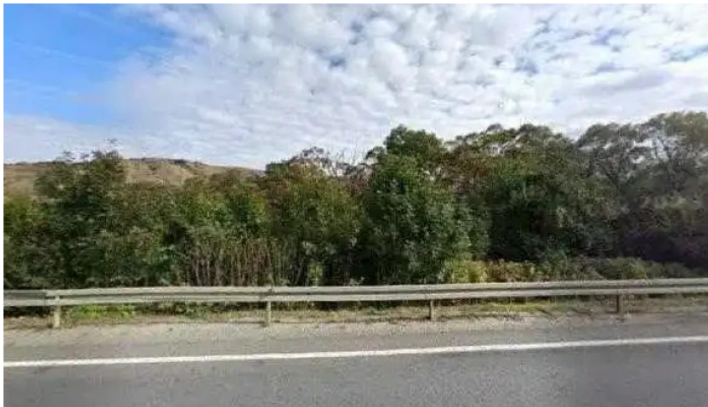
Livada din slimnic street view si 360deg