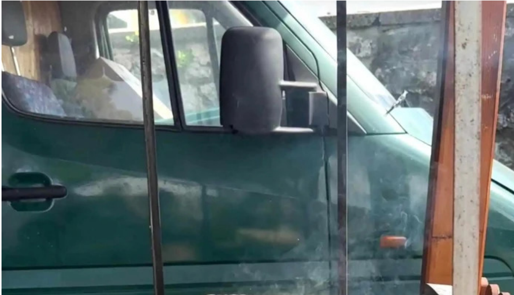
Torockoi kurtoskalacs telefon