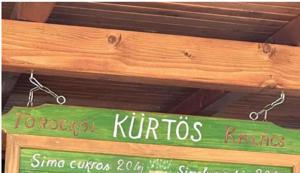
Torockoi kurtoskalacs meniu