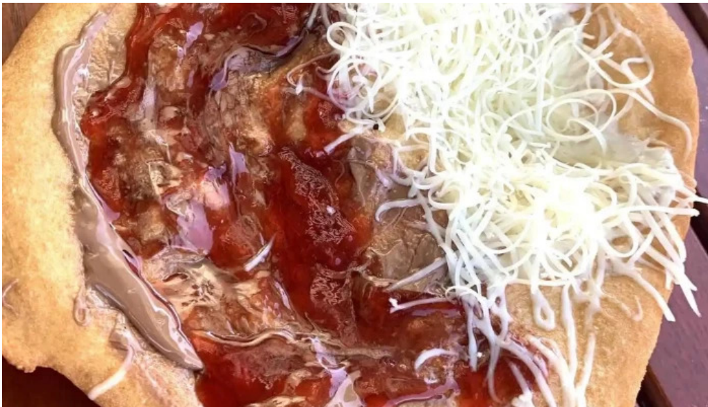
Torockoi kurtoskalacs mancaruribauturi