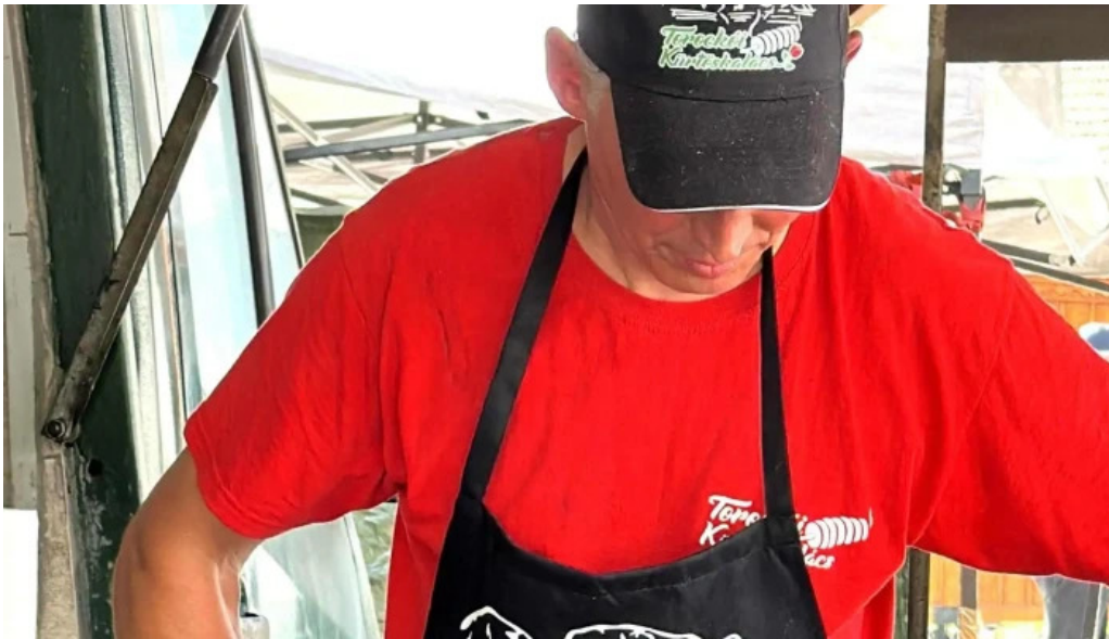
Torockoi kurtoskalacs num?r