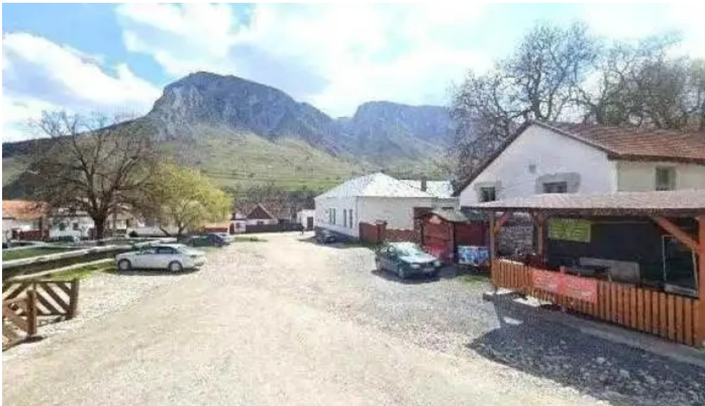
Torockoi kurtoskalacs street view si 360deg