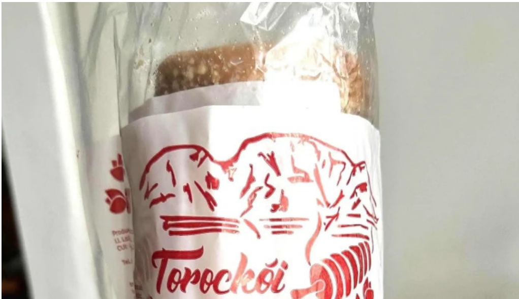
Torockoi kurtoskalacs recenzii