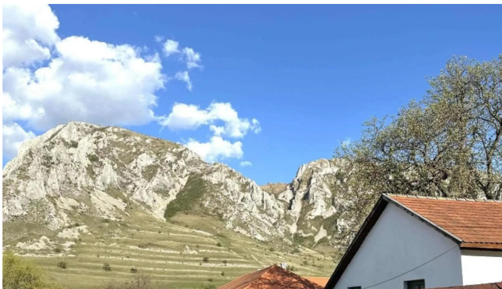
Torockoi kurtoskalacs catalog