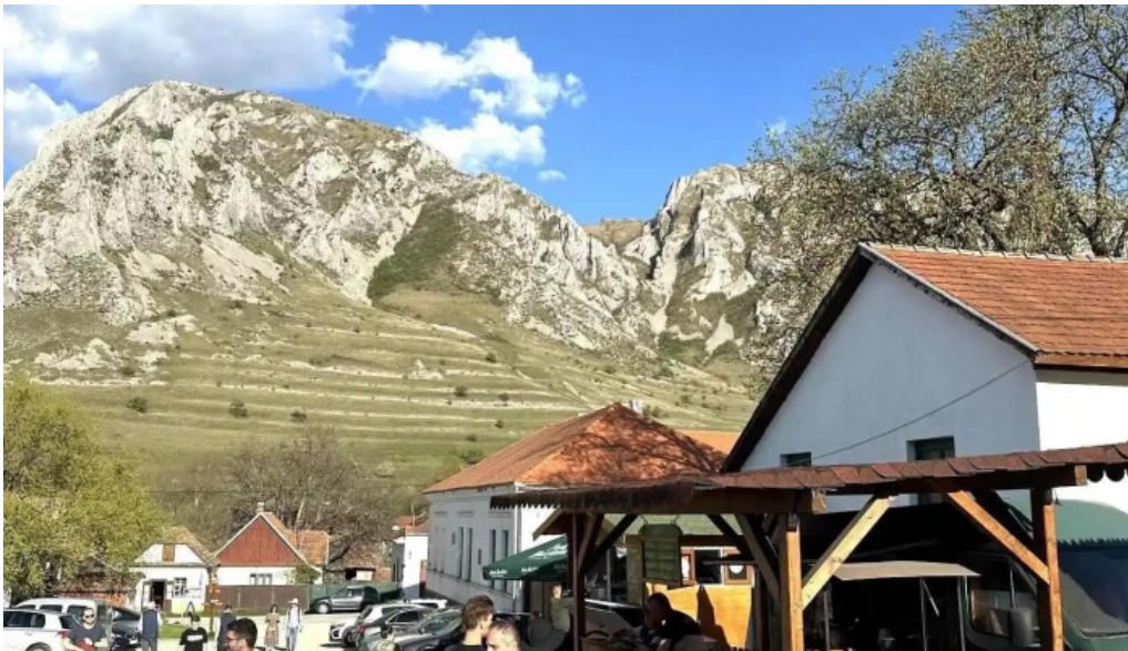
Torockoi kurtoskalacs cele mai recente