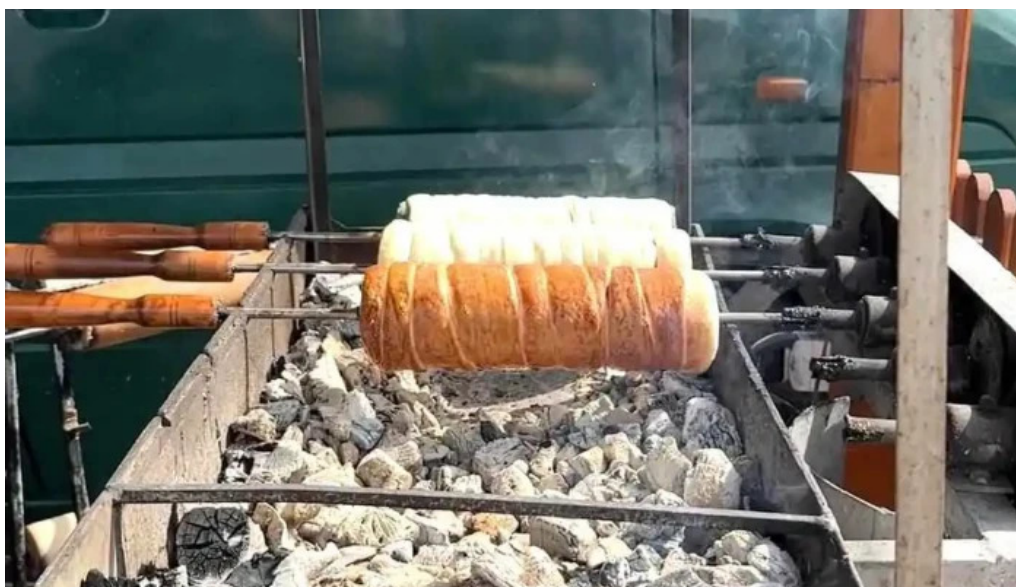
Torockoi kurtoskalacs videoclipuri