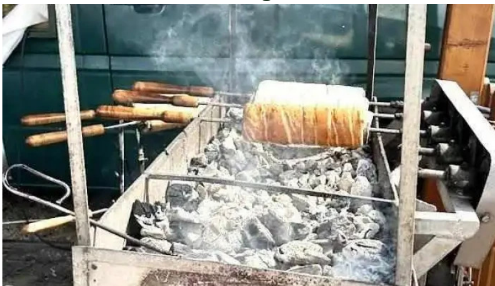
Torockoi kurtoskalacs rimetea