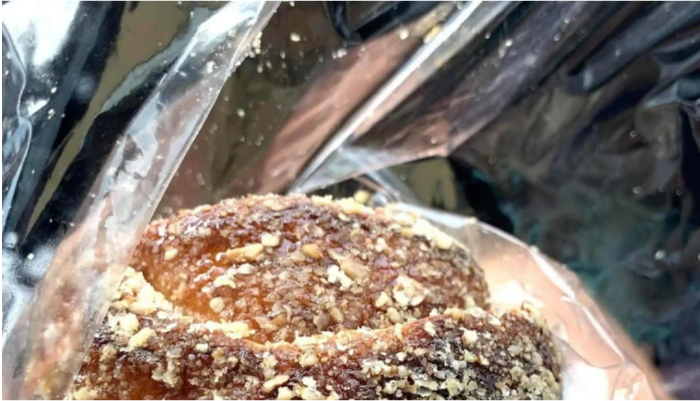
Torockoi kurtoskalacs rimetea