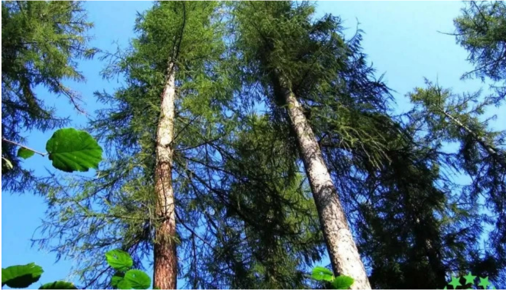
P?durea de larice co?tiui romania