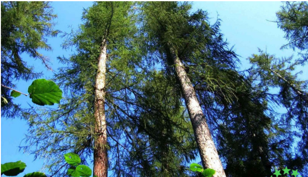
Padurea de larice costiui program