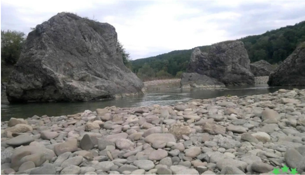
Blocurile de calcar de la badila munte