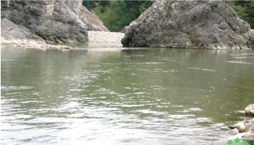
Blocurile de calcar de la badila deschis acum