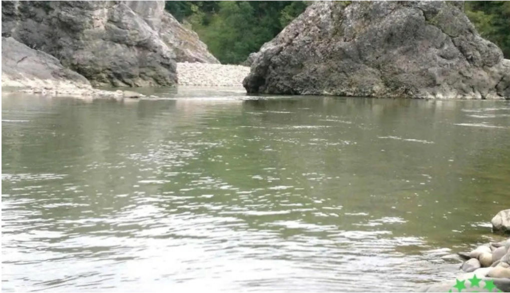
Blocurile de calcar de la b?dila vipere?ti