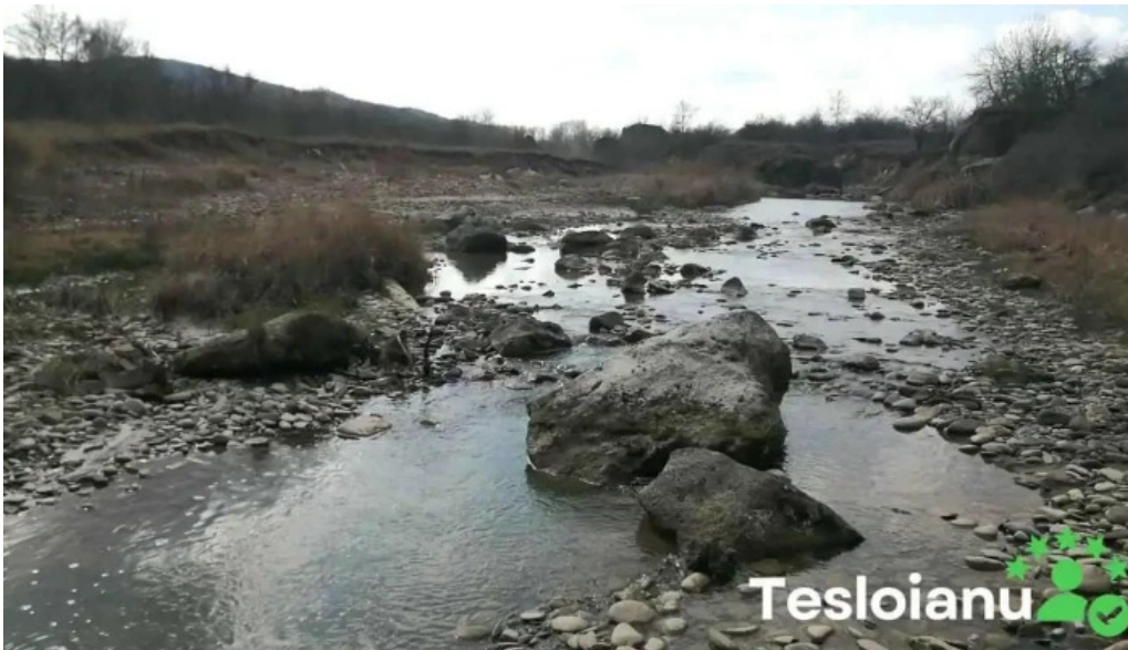
Blocurile de calcar de la badila videoclipuri