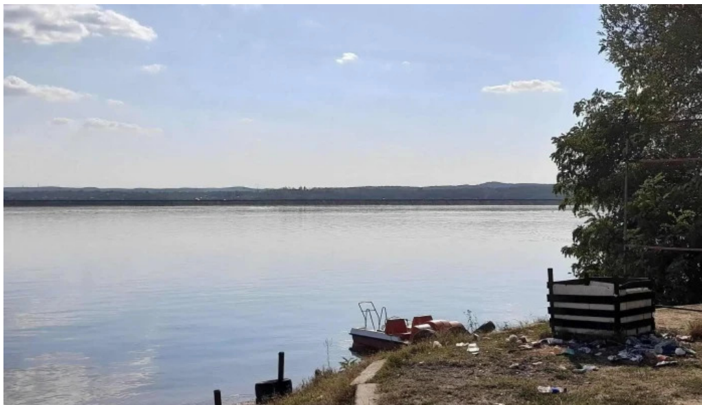
Lacul budeasa instagram