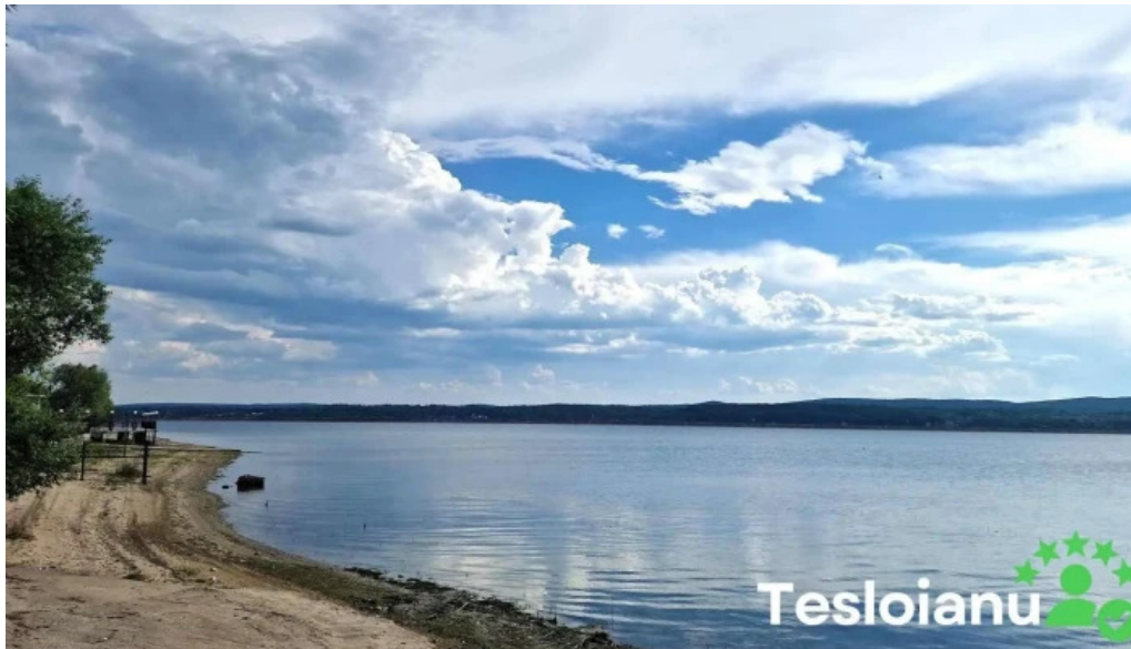
Lacul budeasa lac de acumulare