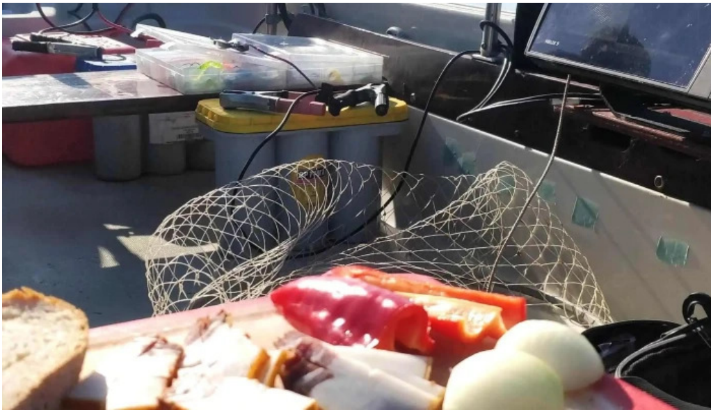
Lacul budeasa loca?ie