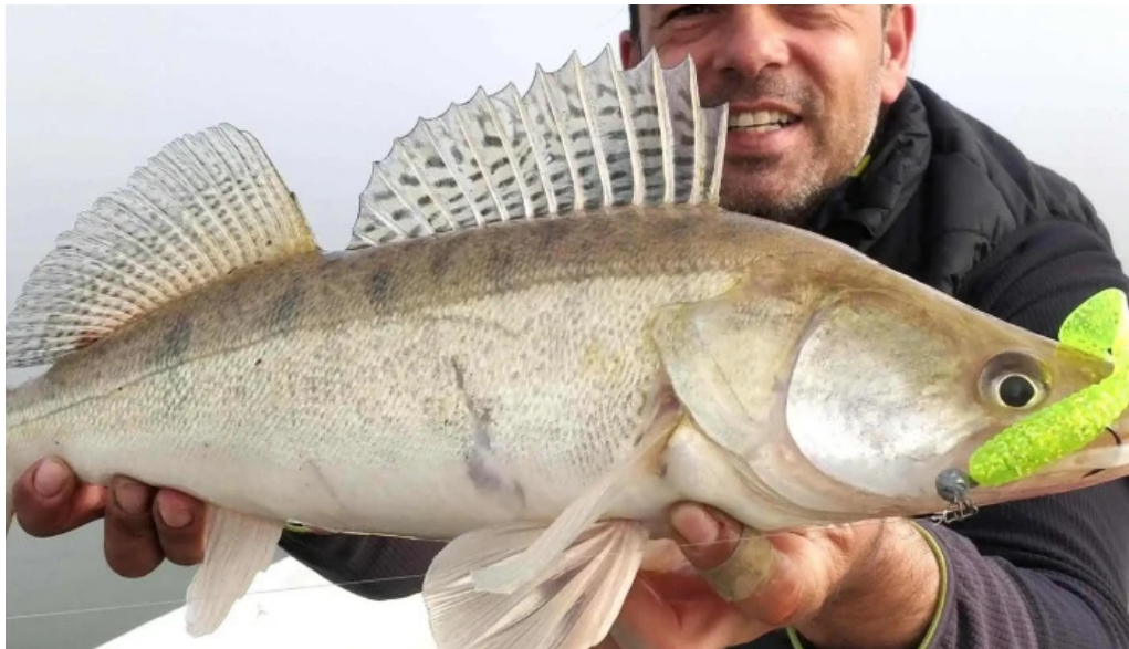
Lacul budeasa cum s? ajungi acolo