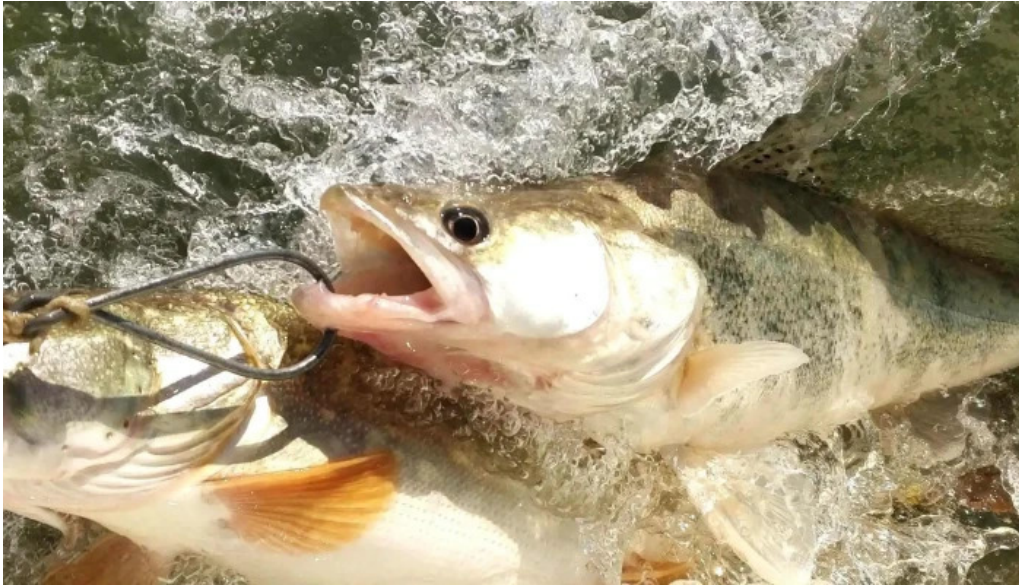
Lacul budeasa aproape de mine