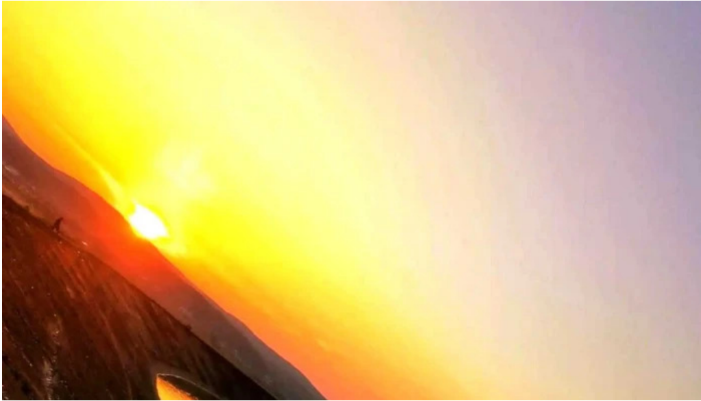
Lacul budeasa romania