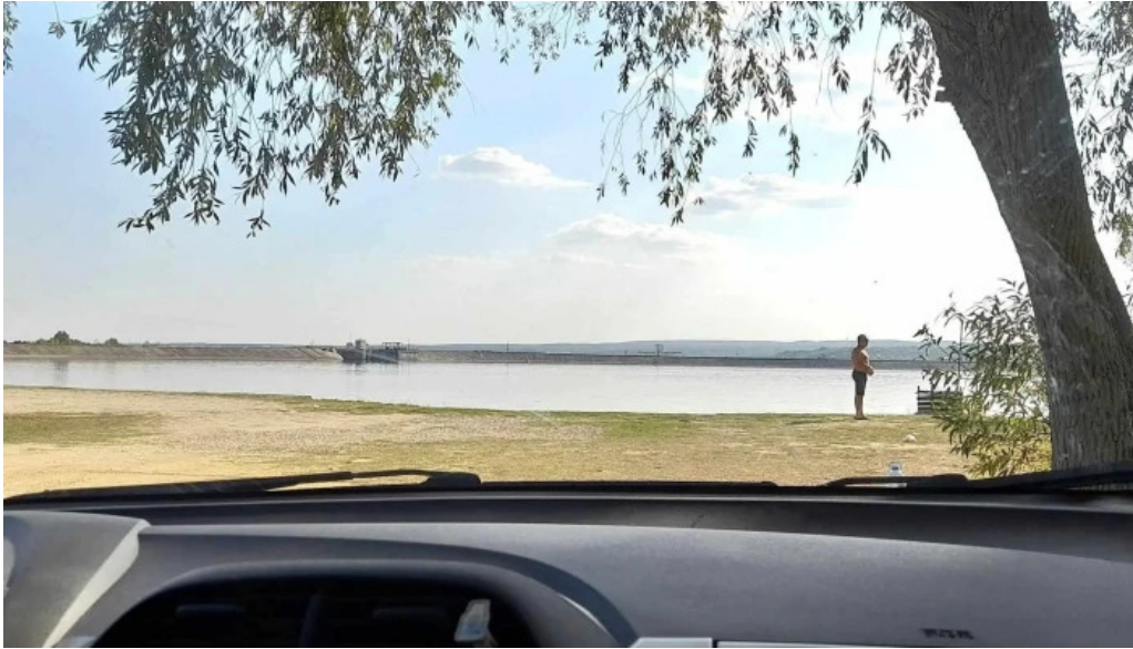
Lacul budeasa videoclipuri