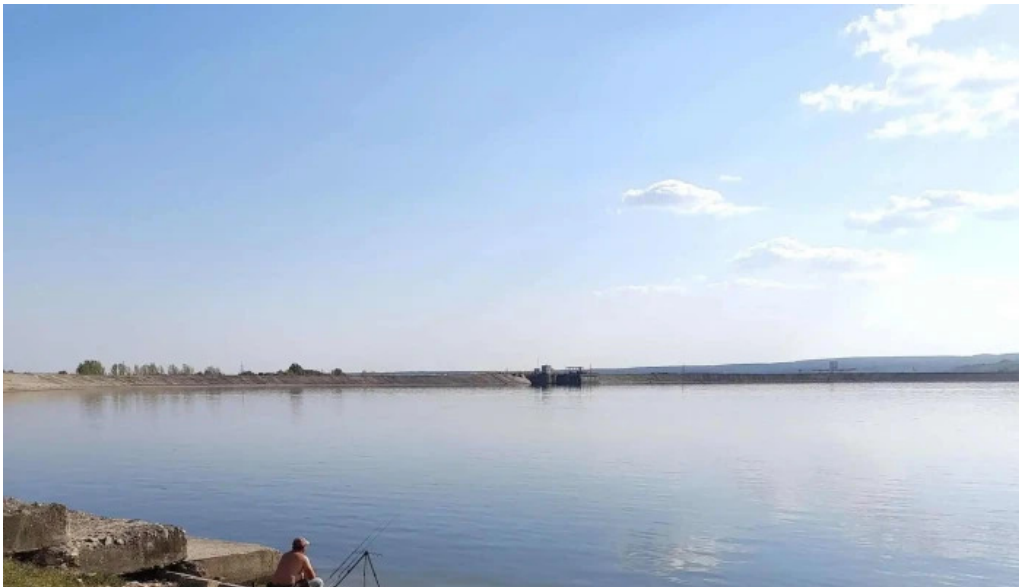
Lacul budeasa adres?