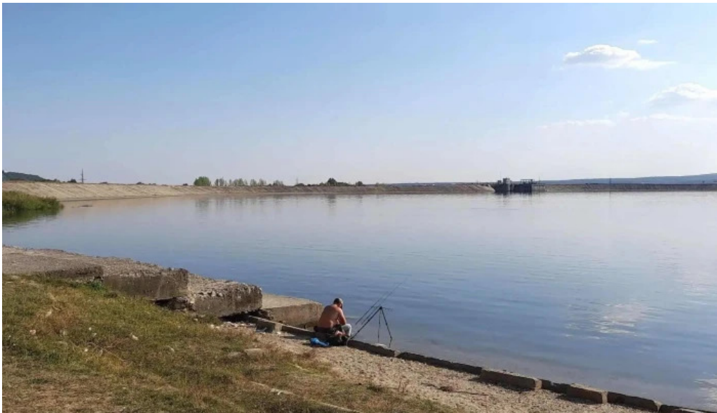
Lacul budeasa site web