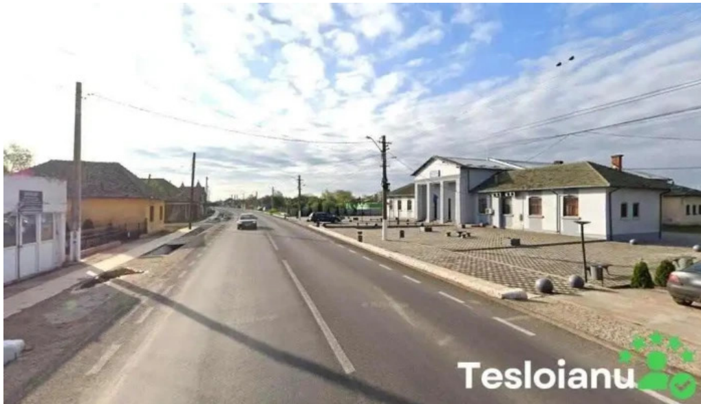
Poli?ia cetate cetate