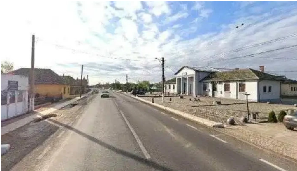
Politia cetate recenzii