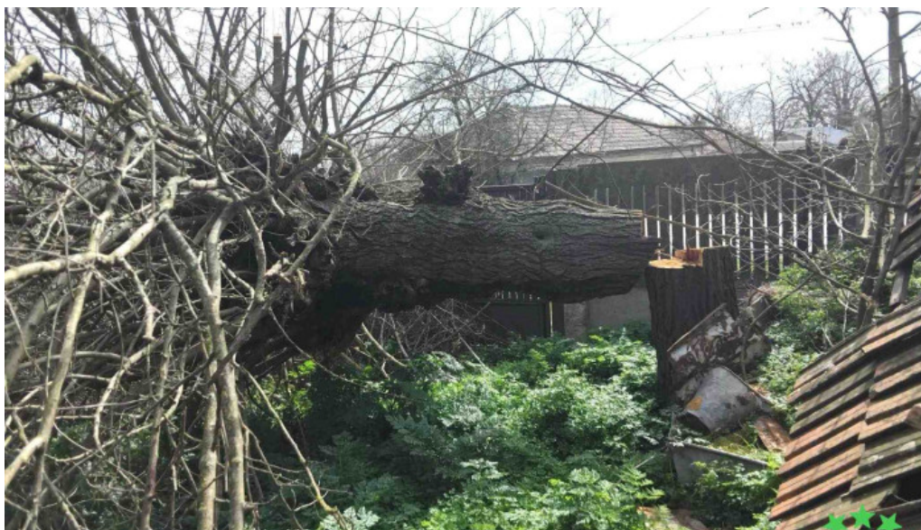
Primaria sprancenata reduceri