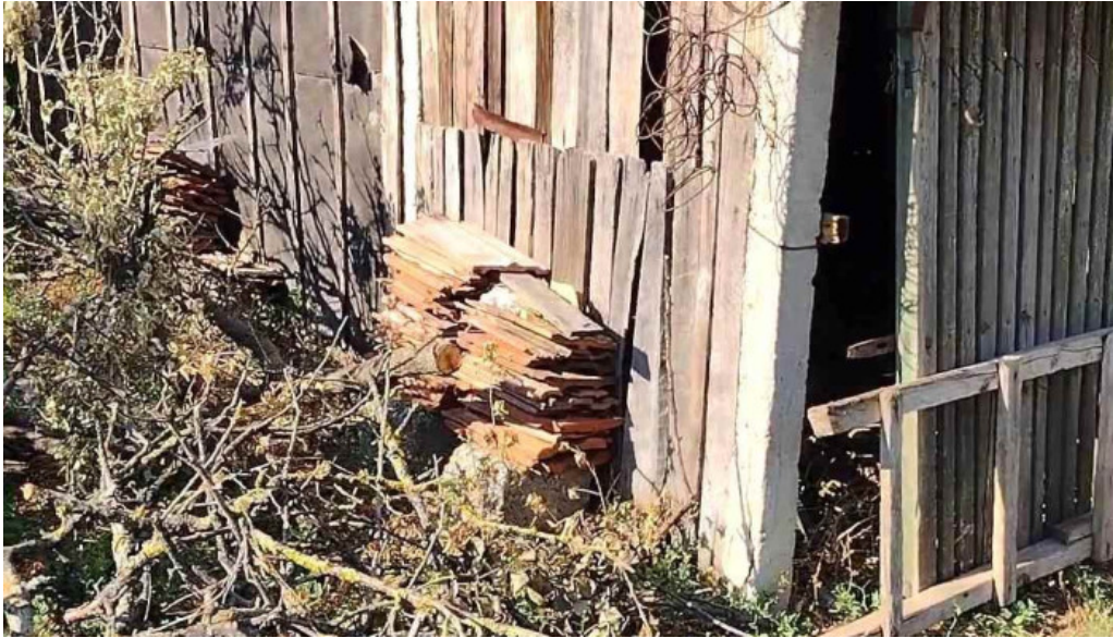
Primaria sprancenata videoclipuri