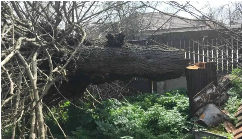
Primaria sprancenata sprancenata