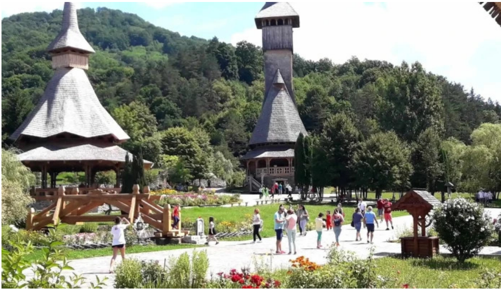
Barsana site web