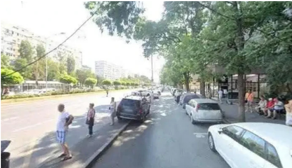
Chei militari gorjului chei chei autoprogramat chei clonat cipuri tocilarie street view si 360deg