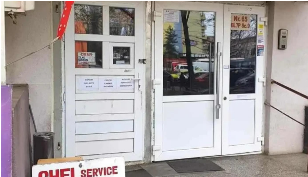
Chei militari gorjului chei chei autoprogramat chei clonat cipuri tocilarie telefon