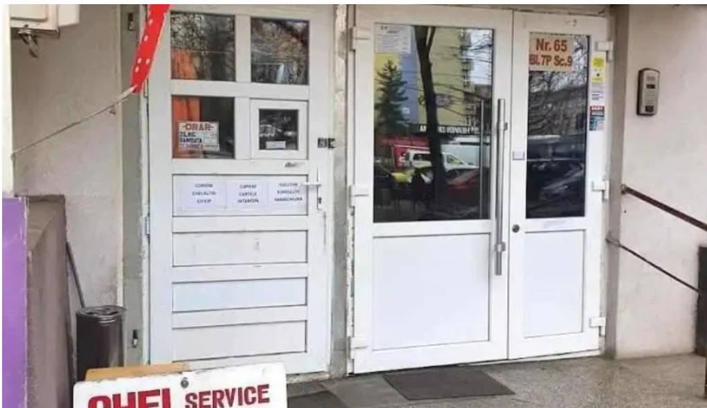
Chei militari gorjului chei chei auto programat chei clonat cipuri tociarie bucure?ti