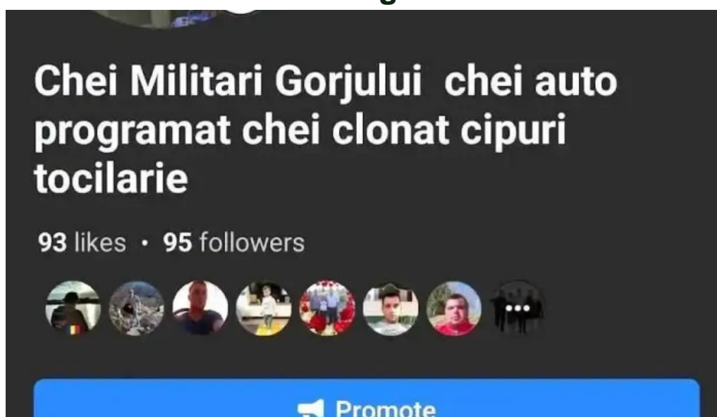
Chei militari gorjului chei chei autoprogramat chei clonat cipuri tociarie videoclipuri