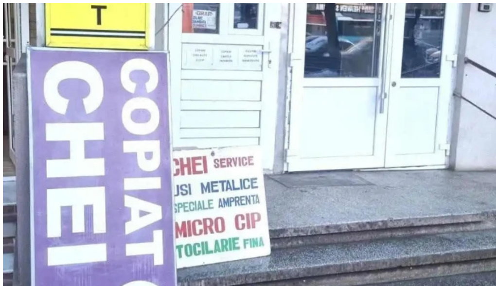
Chei militari gorjului chei chei autoprogramat chei clonat cipuri tocilarie exterior