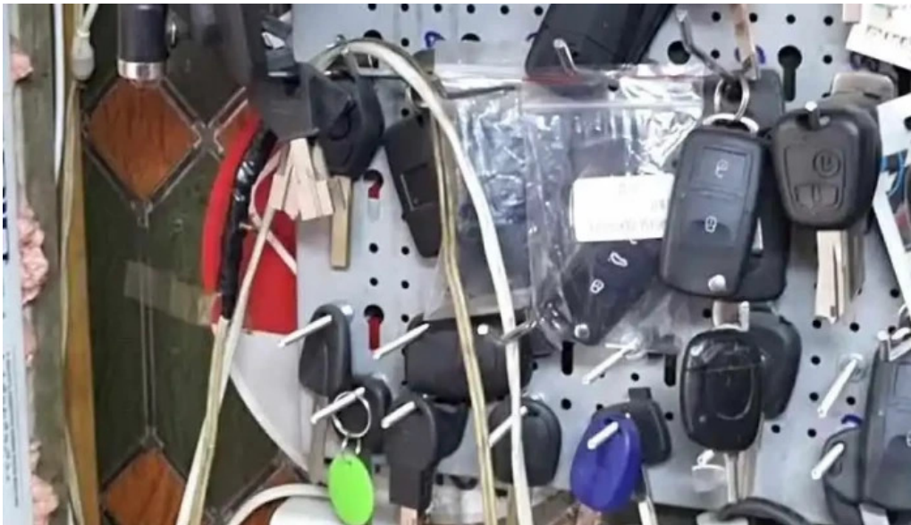
Chei militari gorjului chei chei autoprogramat chei clonat cipuri tociarie de la proprietar