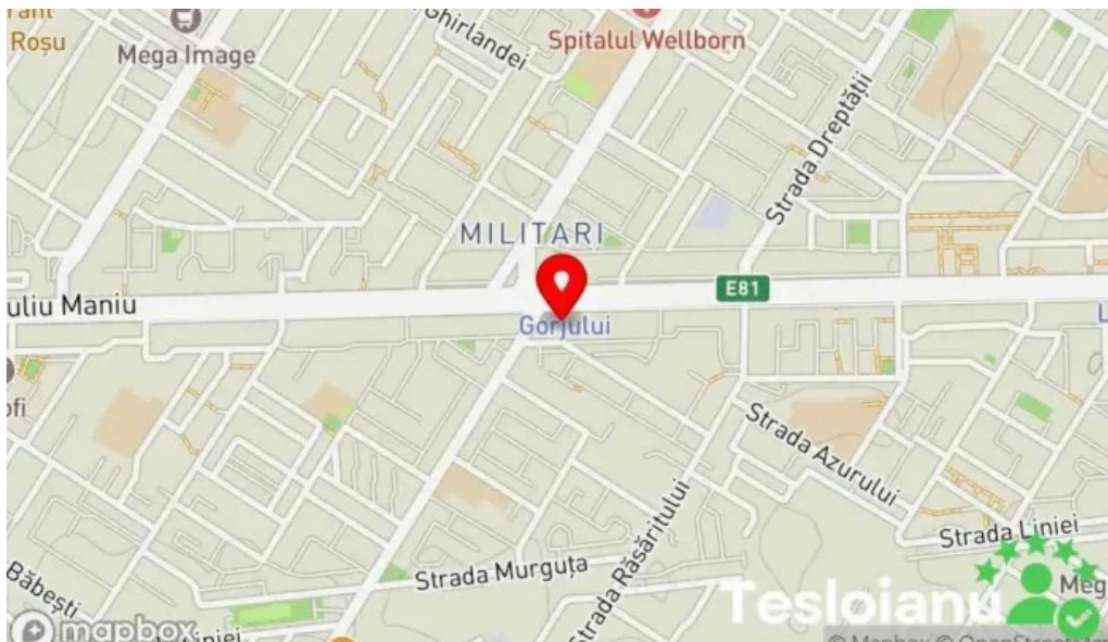
Chei militari gorjului chei chei autoprogramat chei clonat cipuri tocilarie hart?