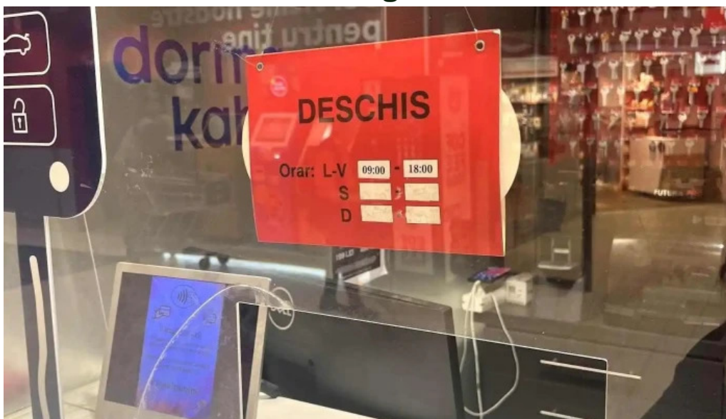
Copiere chei kaufland racari num?