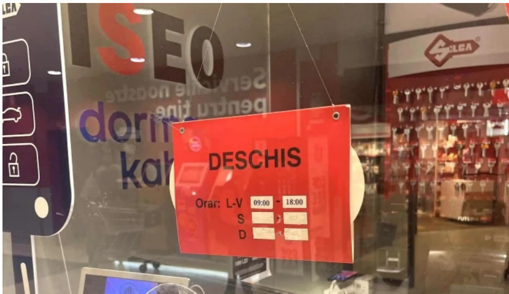
Copiere chei kaufland racari bucure?ti