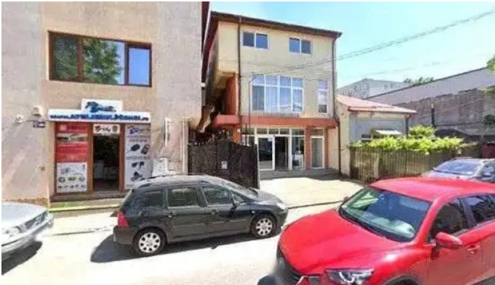
Atelierul de chei constanta street view si 360deg