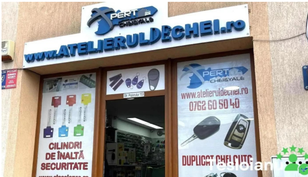
Atelierul de chei constanta program