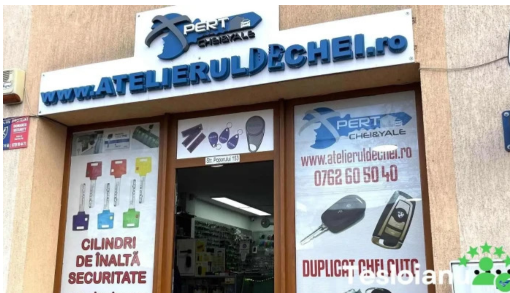
Atelierul de chei constanta constanta