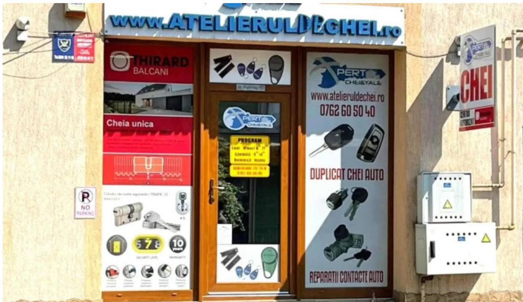
Atelierul de chei constanta exterior