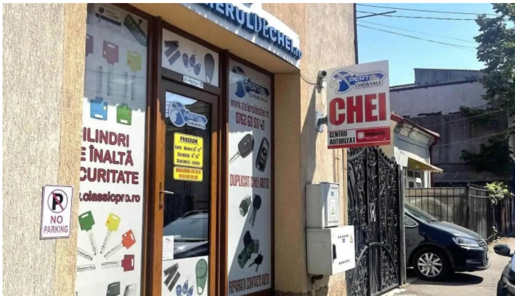
Atelierul de chei constanta de la proprietar