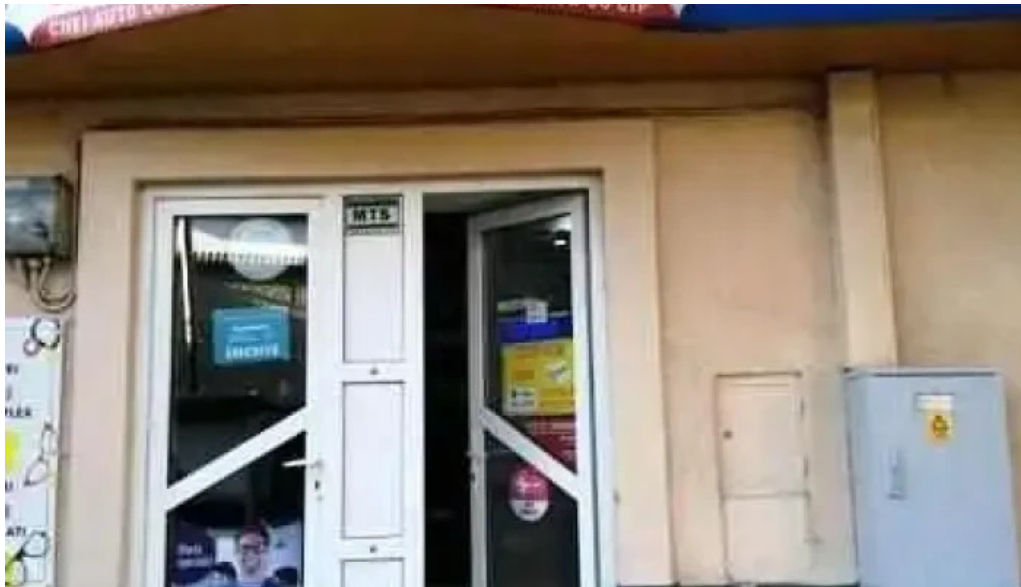
Centru de copiat chei targu cucu exterior