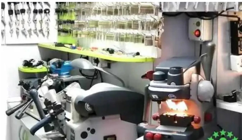
Centru de copiat chei targu cucu cum s? ajungi acolo