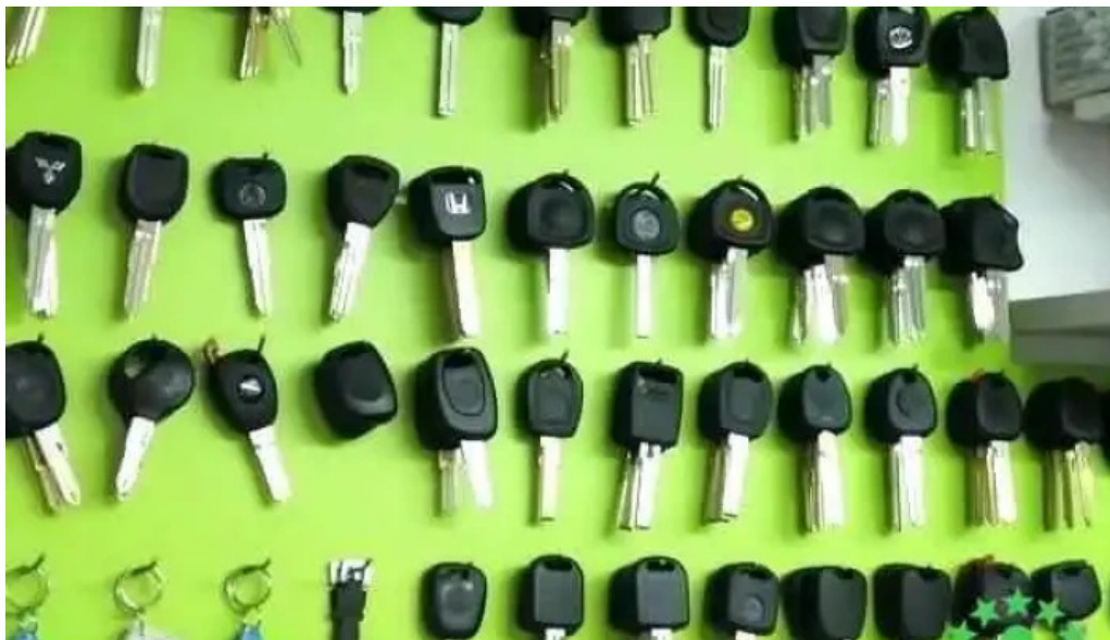
Centru de copiat chei targu cucu de la proprietar