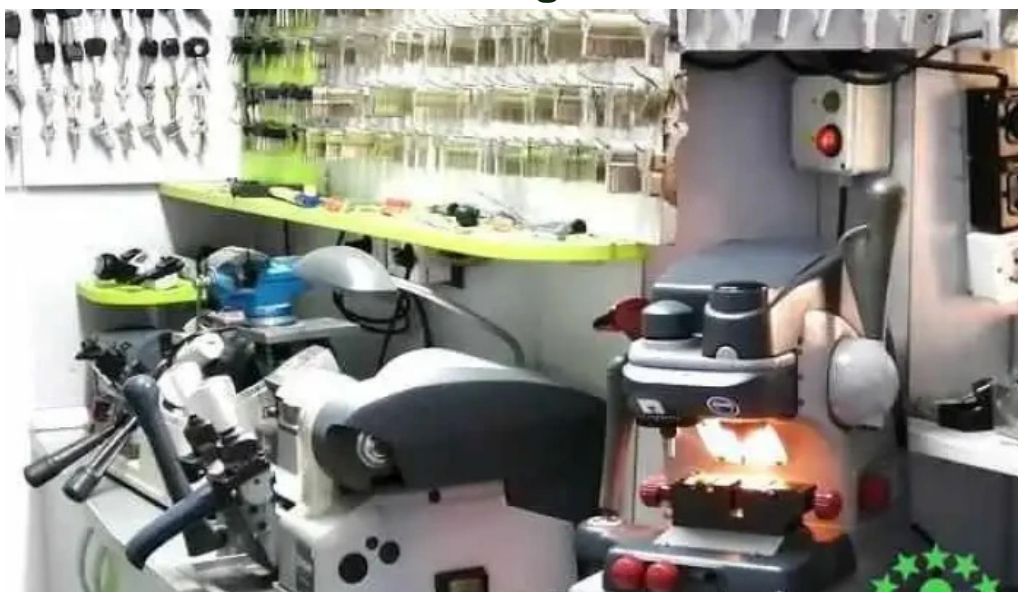
Centru de copiat chei targu cucu ia?i