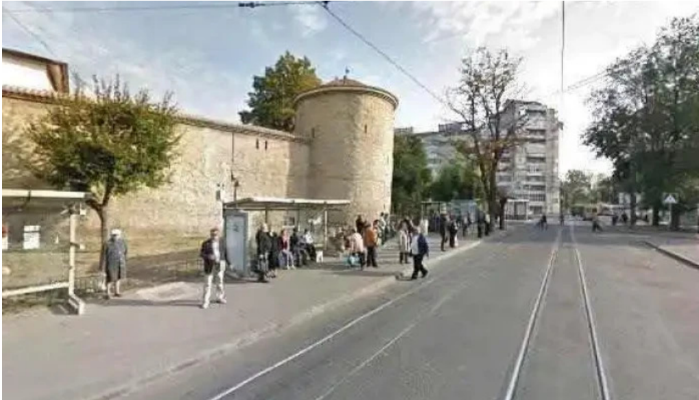
Centru de copiat chei targu cucu street view si 360deg