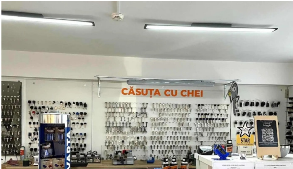
Casuta cu chei srl rasnov adres?