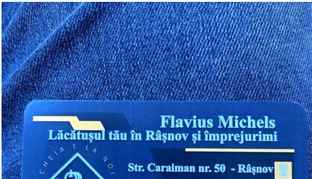
Casuta cu chei srl rasnov num?r