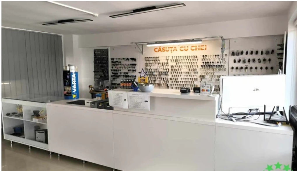
Casuta cu chei srl rasnov interior