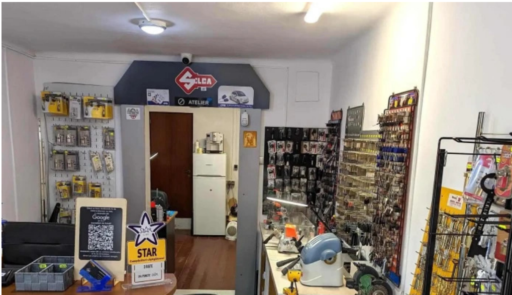
Casuta cu chei srl rasnov comentarii