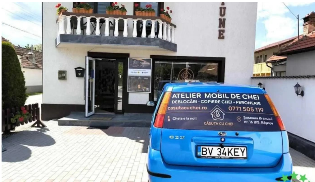
Casuta cu chei s r l ra?nov ra?nov