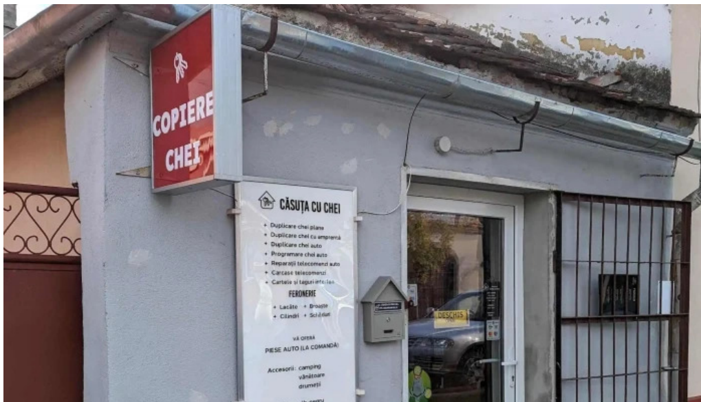
Casuta cu chei srl rasnov videoclipuri