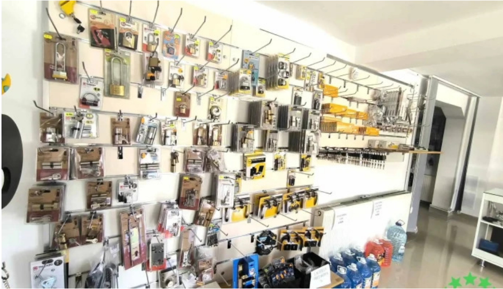
Casuta cu chei srl rasnov de la proprietar