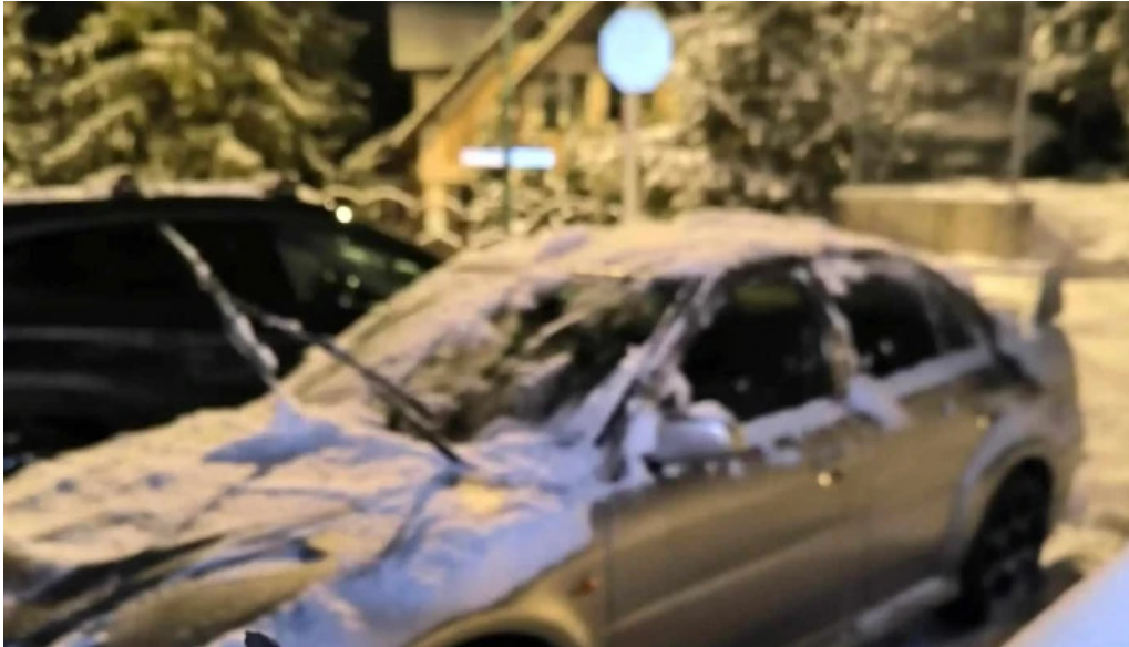
Casuta cu chei srl rasnov promo?ie