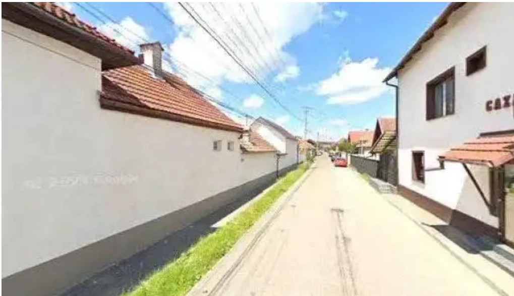
Casuta cu chei srl rasnov street view si 360deg