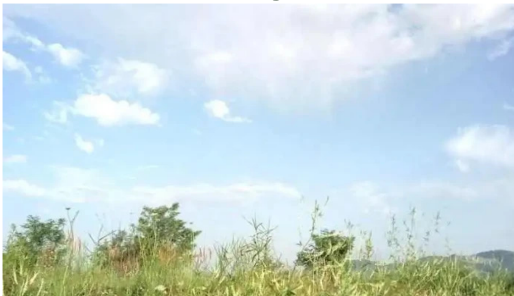
P?dure axente sever romania