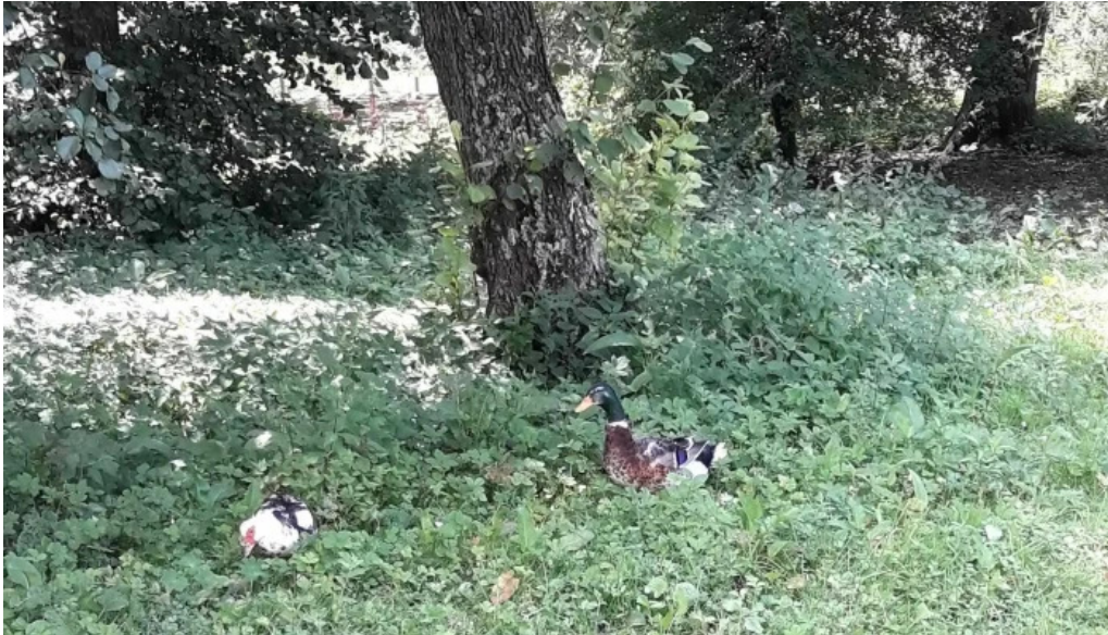
Padure axente sever num?r