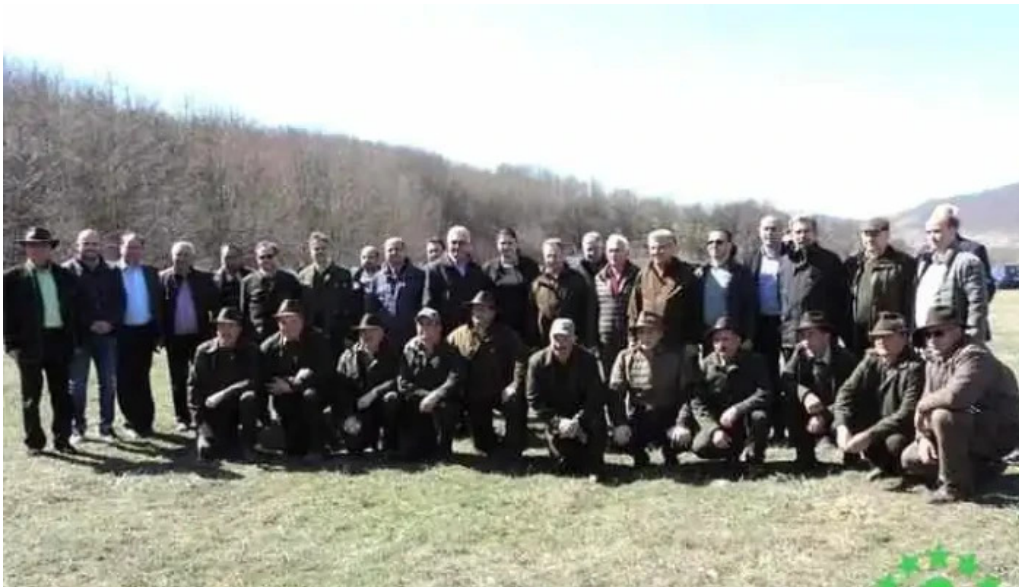
Padure axente sever recreere