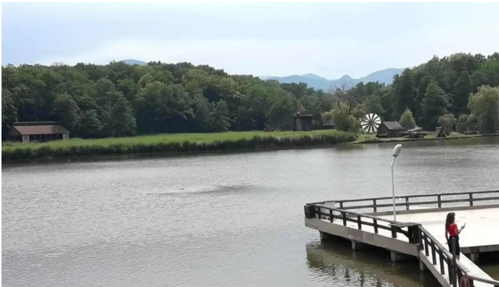
Padure axente sever romania