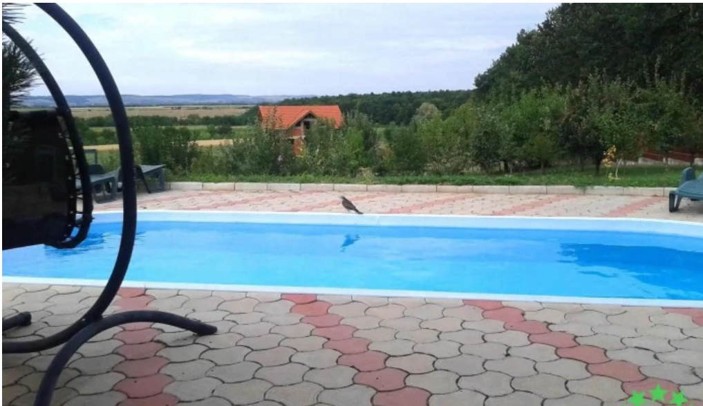
Padurea alparea pre?uri