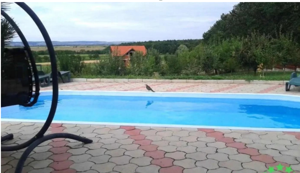
Pădurea alparea romania