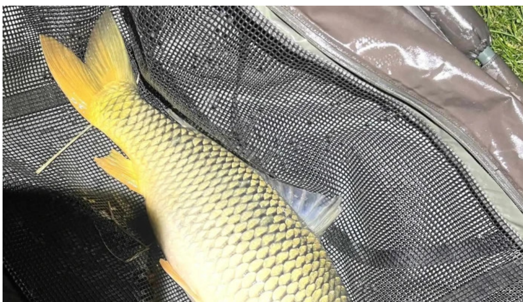
Lac filea 1 aproape de mine