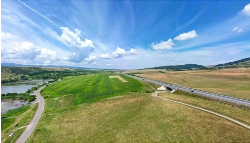
Lac filea 1 street view si 360deg