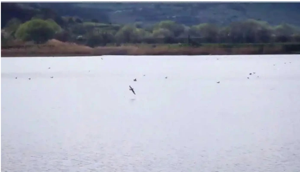
Lac filea 1 videoclipuri