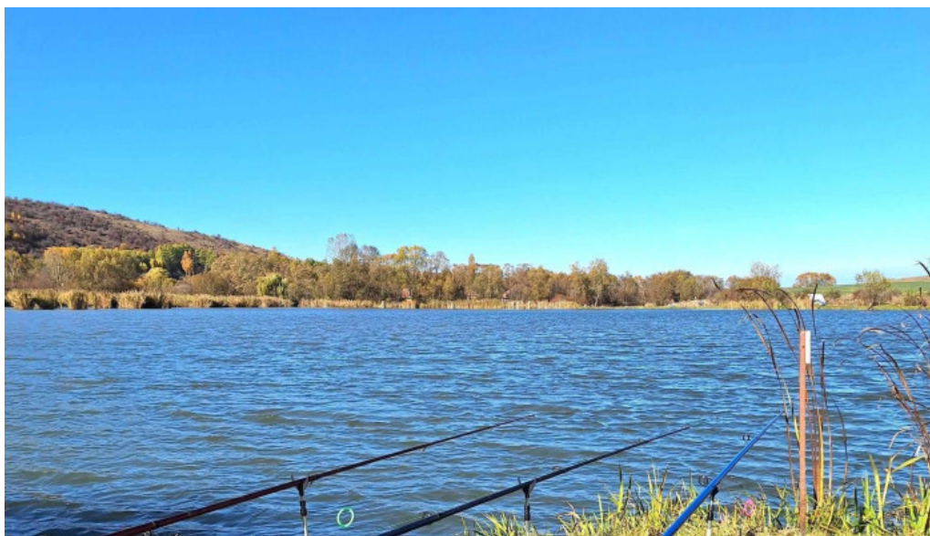
Lac filea 1 comuna ciurila