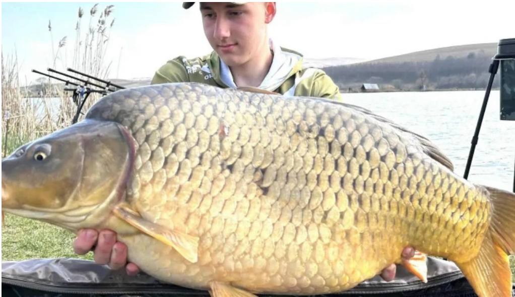
Lac filea 1 scor