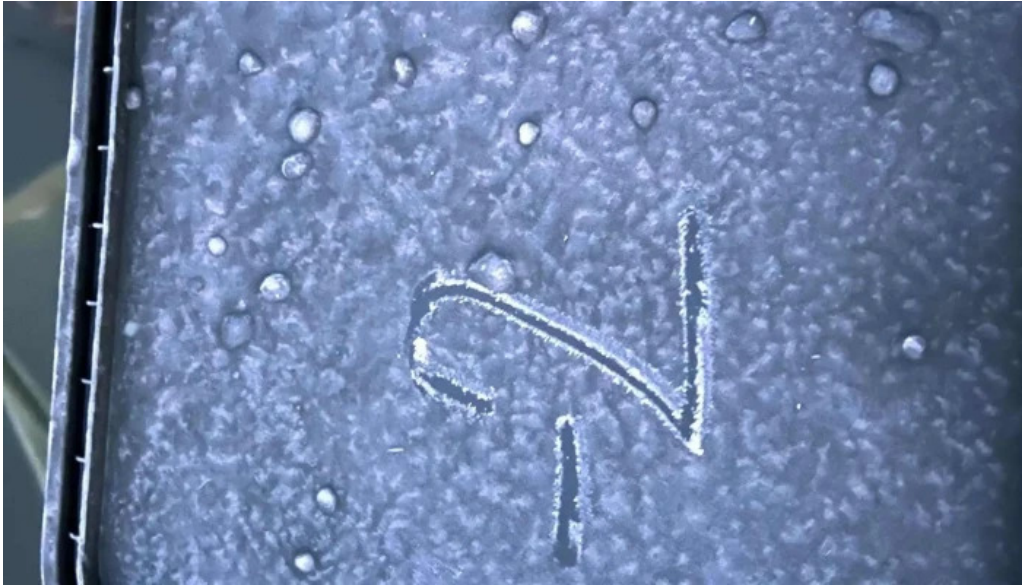
Lac filea 1 promo?ie