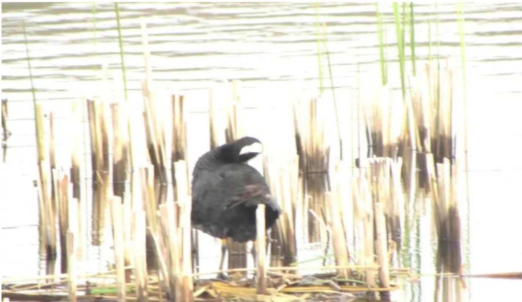
Balta boureni cum s? ajungi acolo