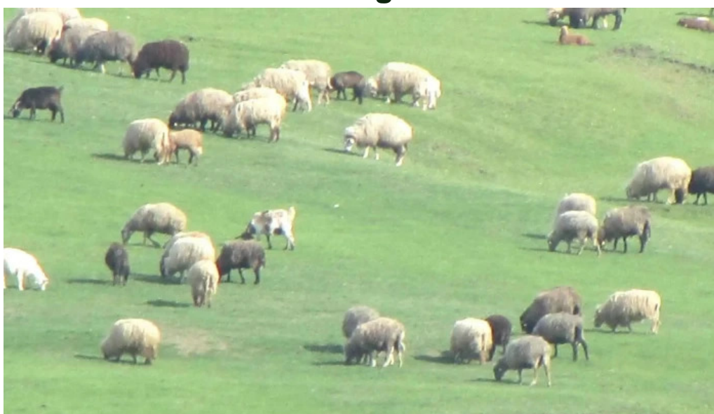
Balta boureni zon?