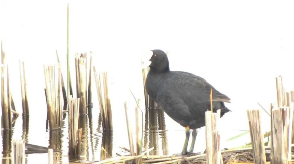
Balta boureni unnamed road