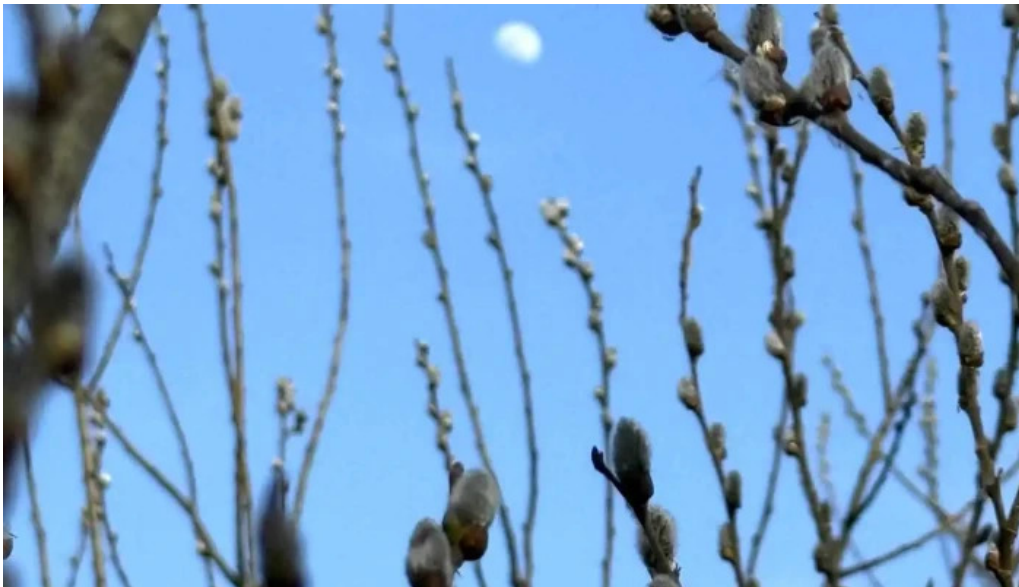
Observator ornitologic comana cele mai recente