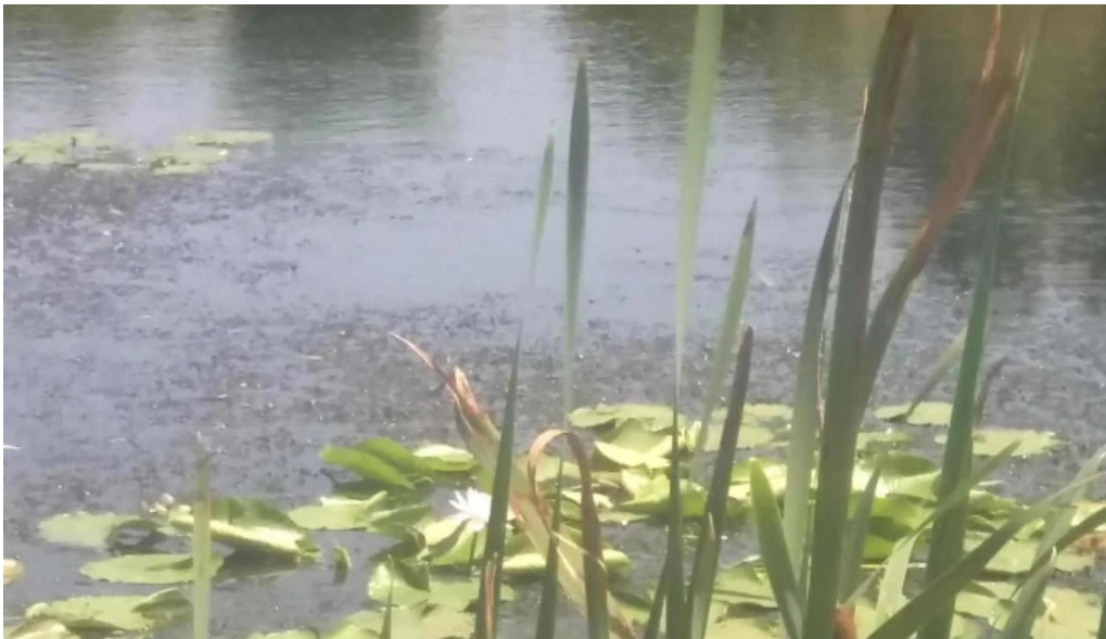
Observator ornitologic comana cum s? ajungi acolo