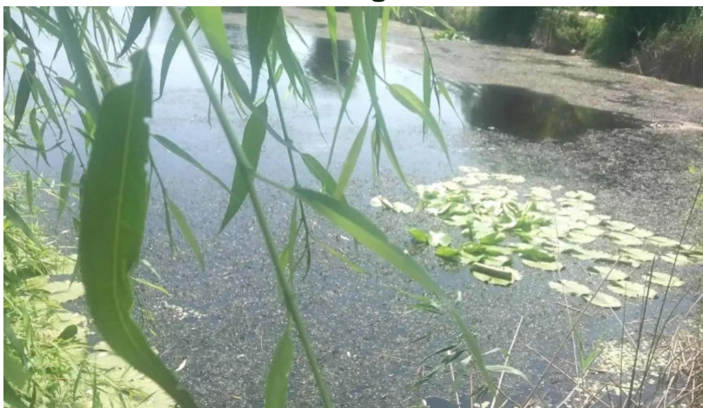
Observator ornitologic comana videoclipuri