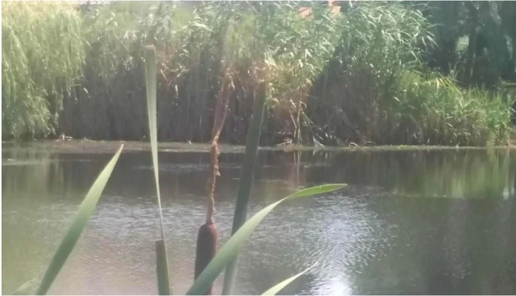
Observator ornitologic comana promo?ie