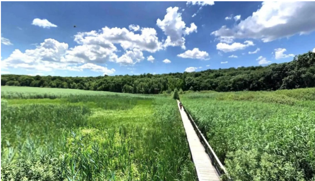
Observator ornitologic comana street view si 360deg