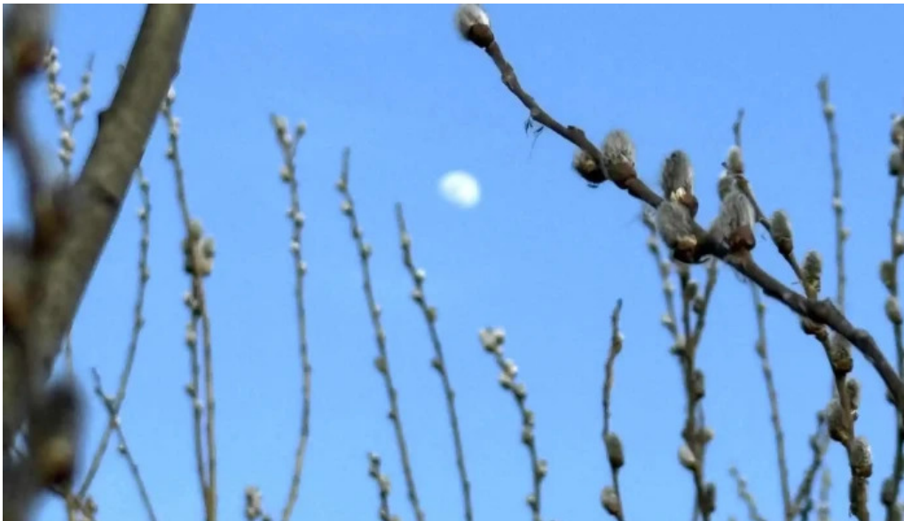
Observator ornitologic comana rezerva?ie comana