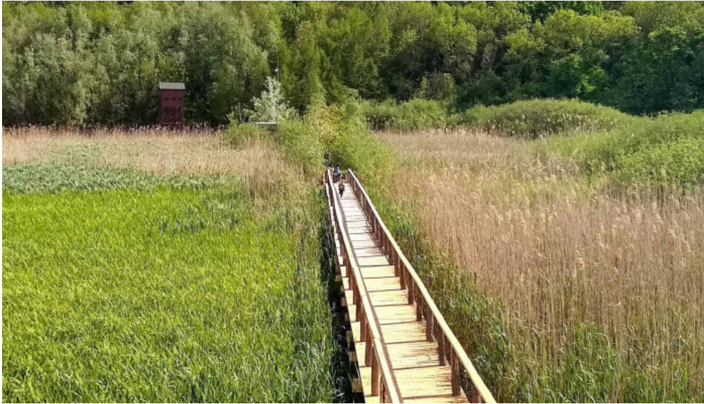
Observator ornitologic comana fotografii