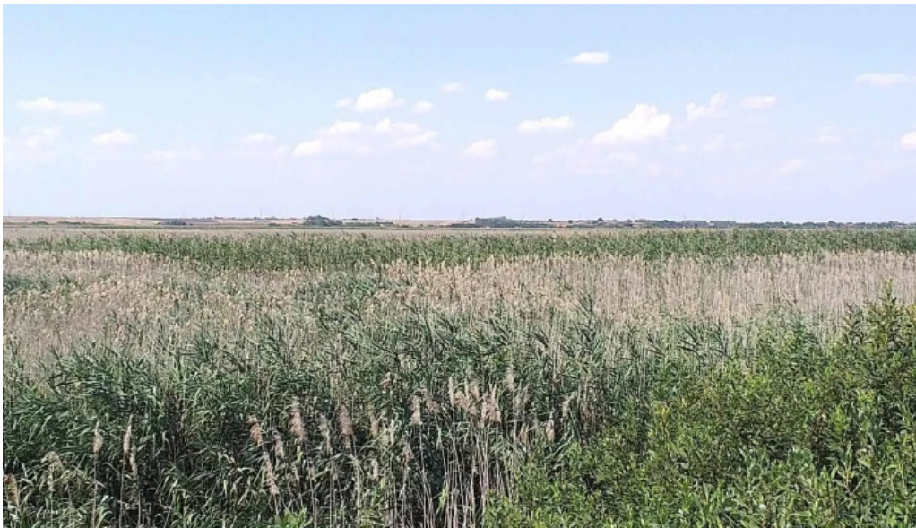
Observator ornitologic comana program