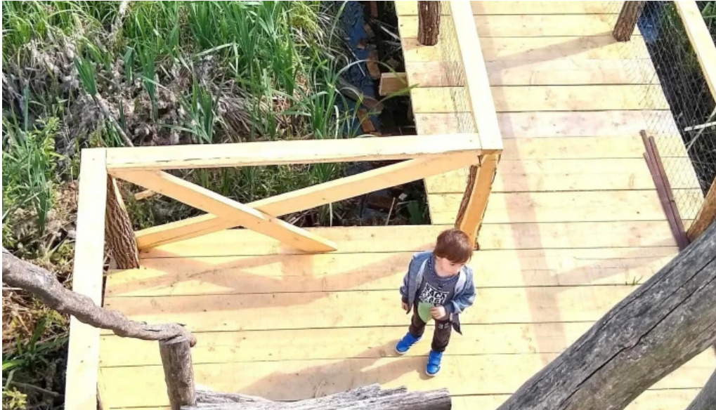
Observator ornitologic comana comentarii