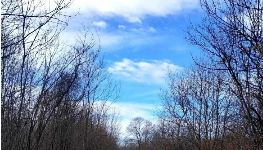
Observator ornitologic comana loca?ie