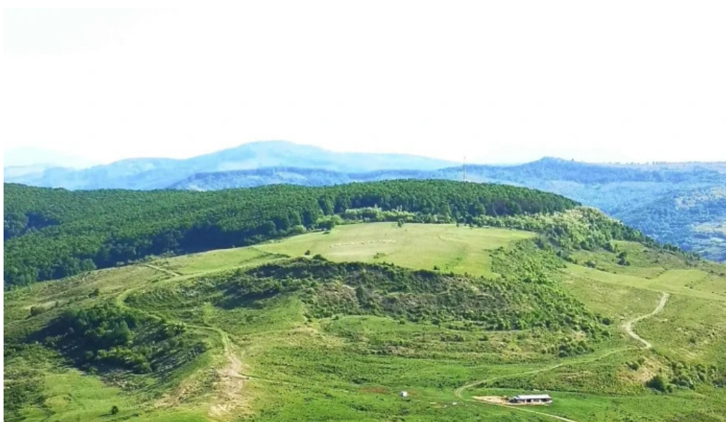
Ciceu giurgesti ciceu giurge?ti