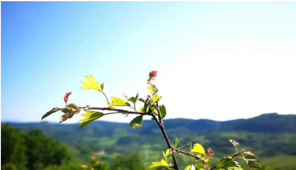
Ciceu giurgesti telefon