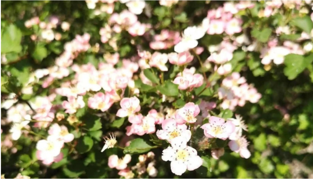
Ciceu giurgesti videoclipuri