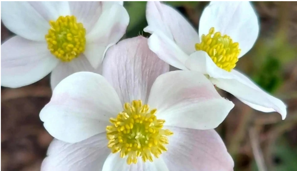
Vf malaia promo?ie