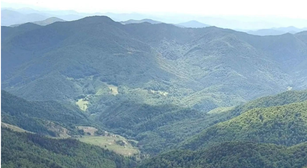
Vf malaia comuna siriu