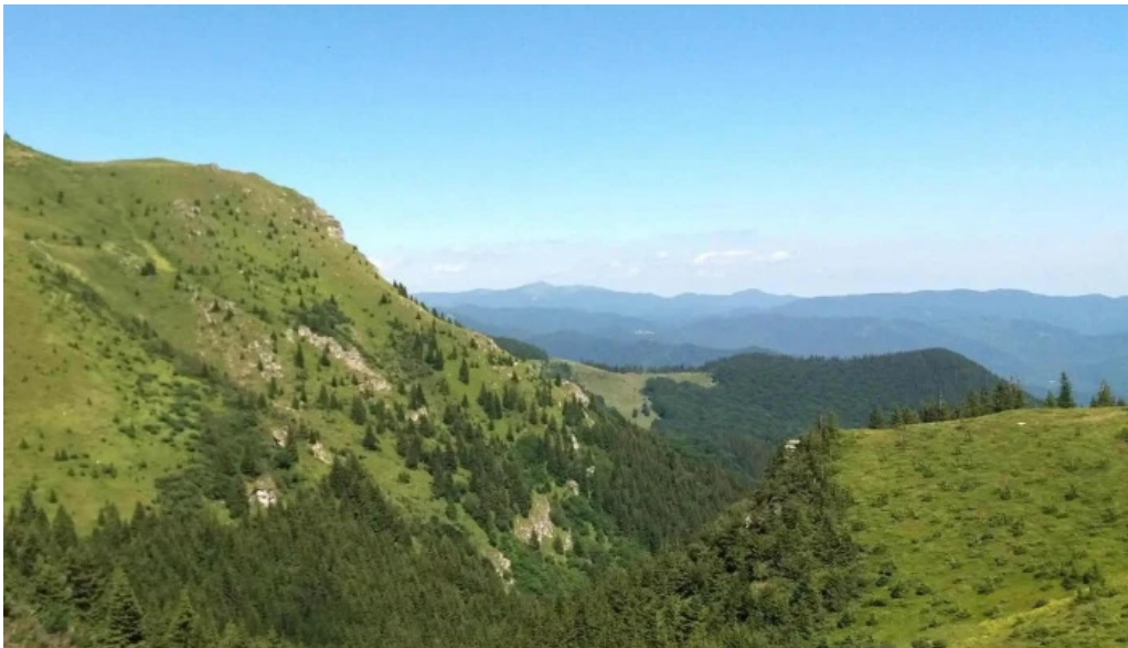
Vf malaia site web