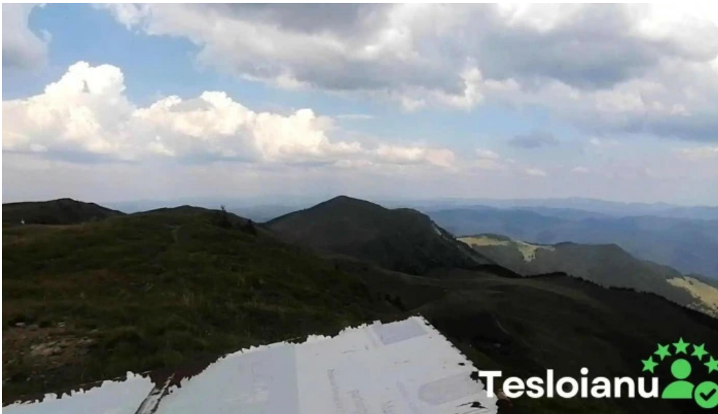
Vf malaia videoclipuri