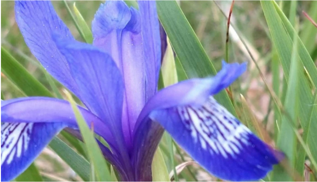
Vf malaia scor