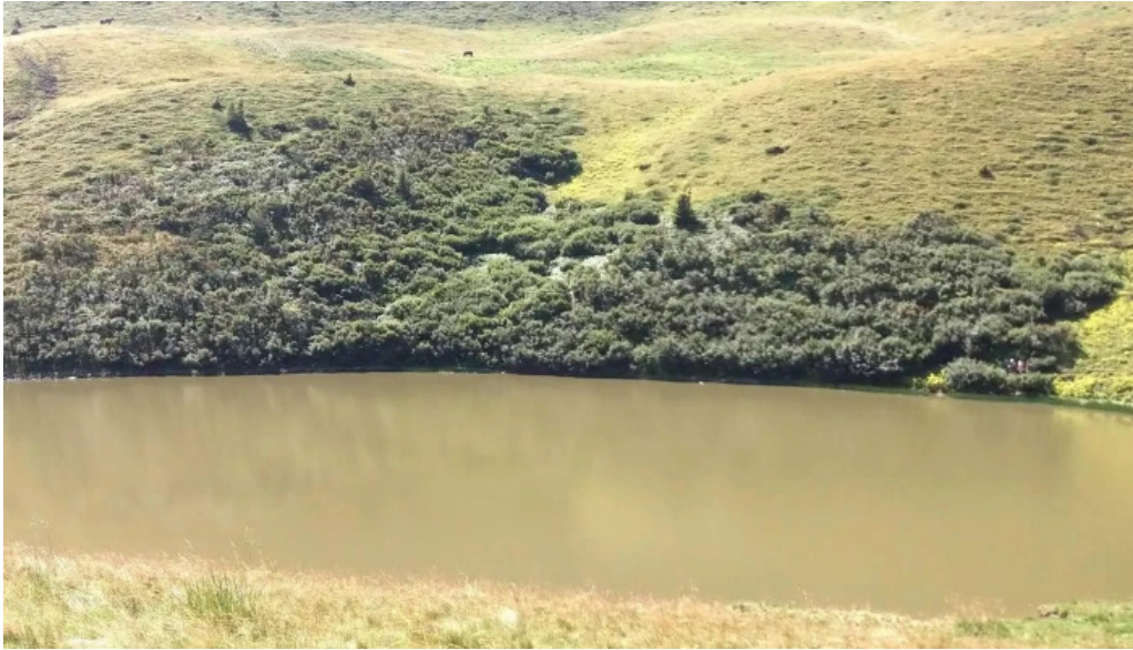
Vf malaia loca?ie