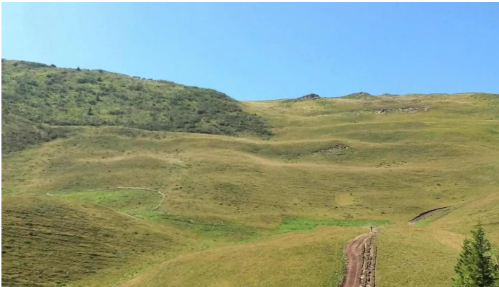
Vf malaia instagram