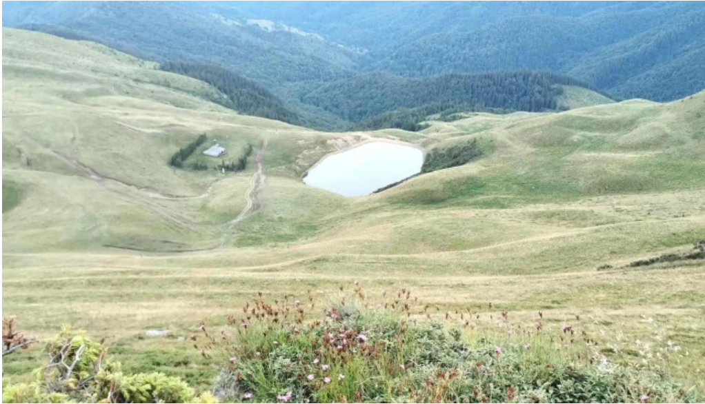
Vf malaia unde