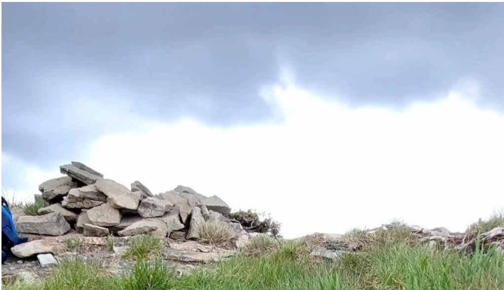
Vf malaia telefon