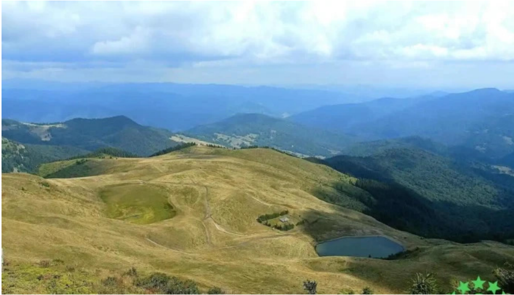
Vf m?laia comuna siriu