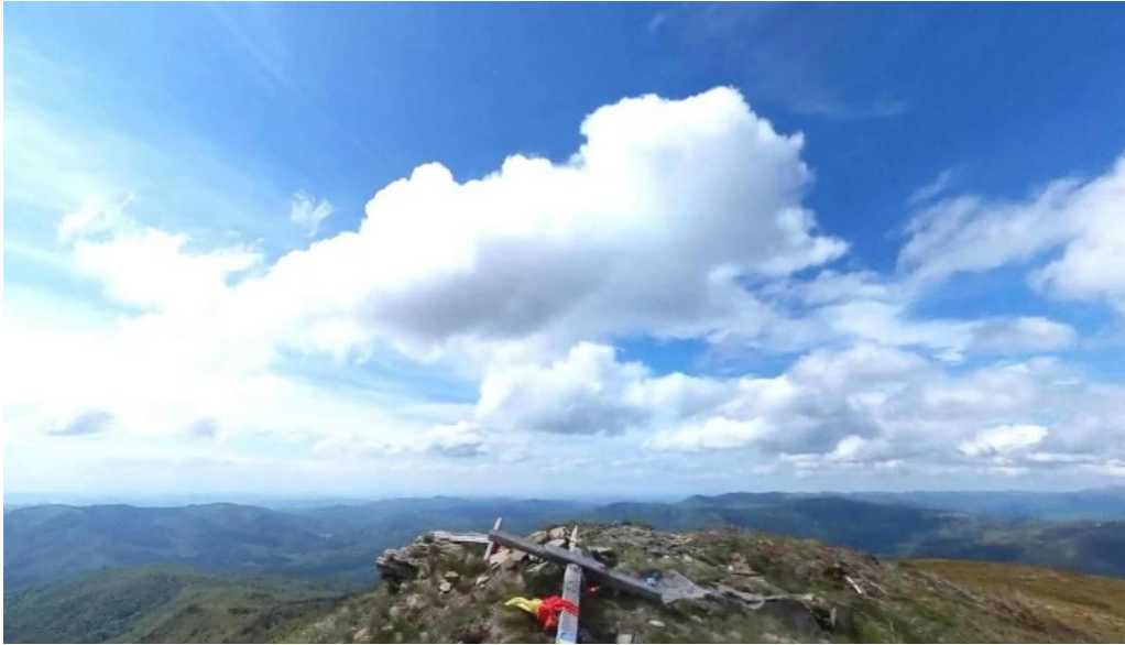
Vf malaia street view si 360deg