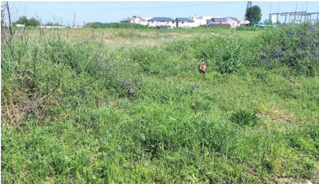
Parcul cernele comentarii