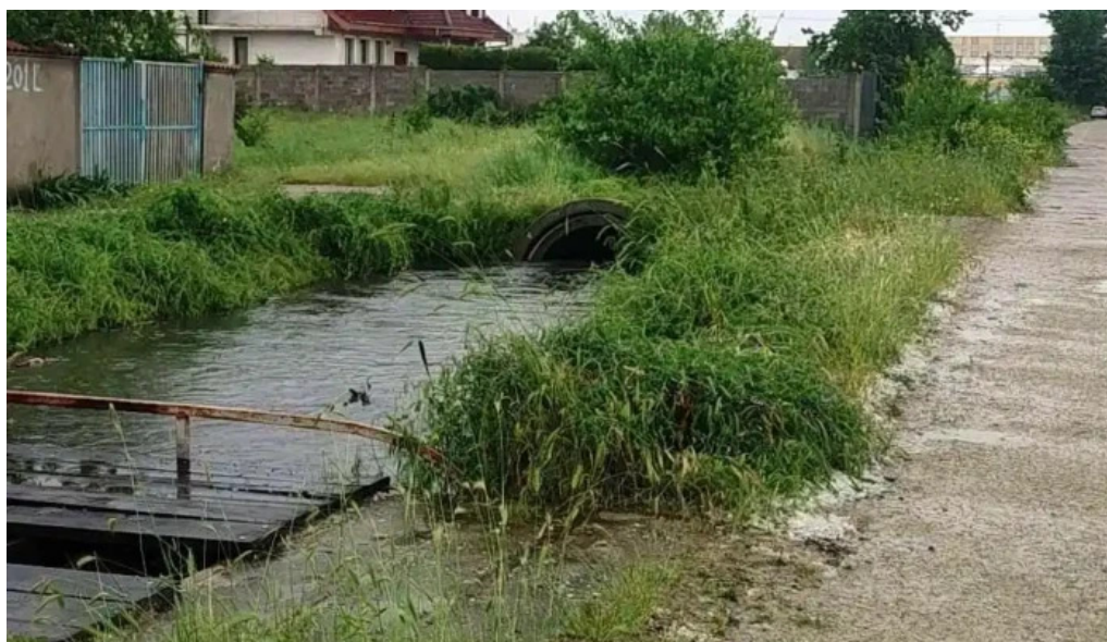
Parcul cernele de la proprietar