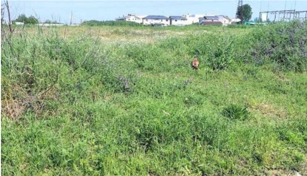
Parcul cernele craiova