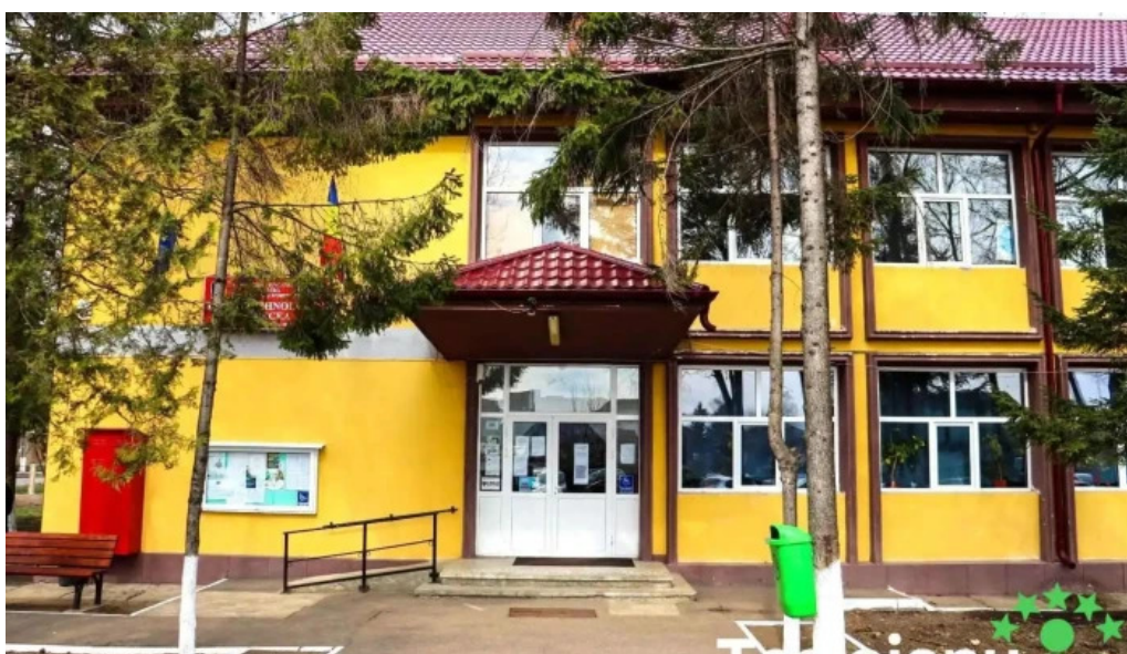
Liceul tehnologic bucecea bucecea