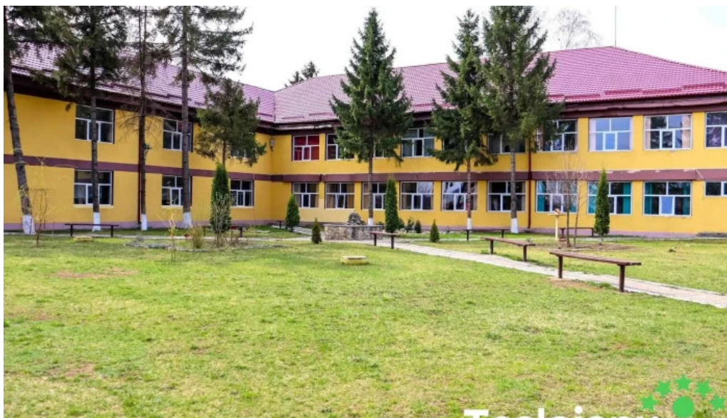
Liceul tehnologic bucecea de la proprietar