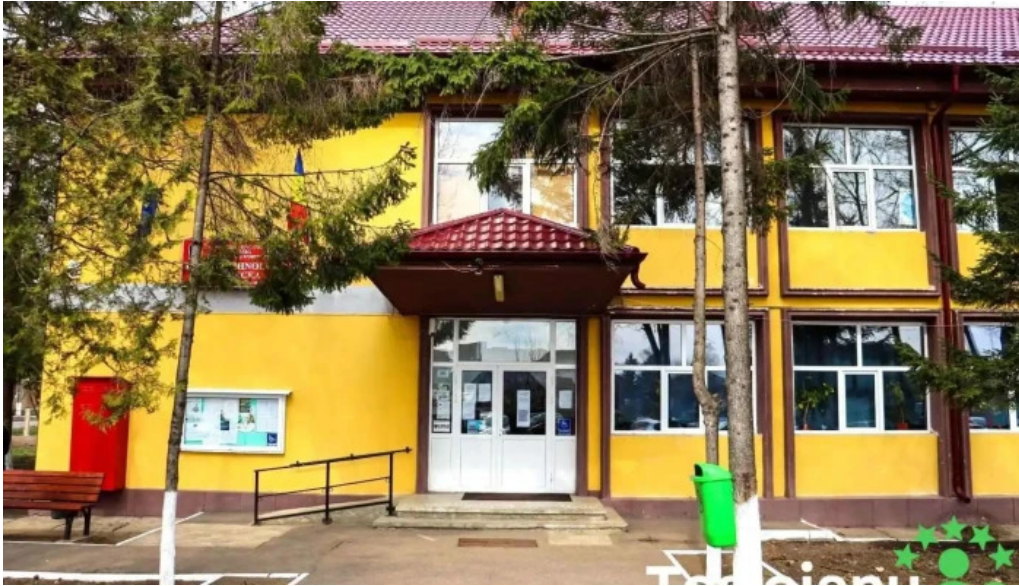
Liceul tehnologic bucecea loca?ie