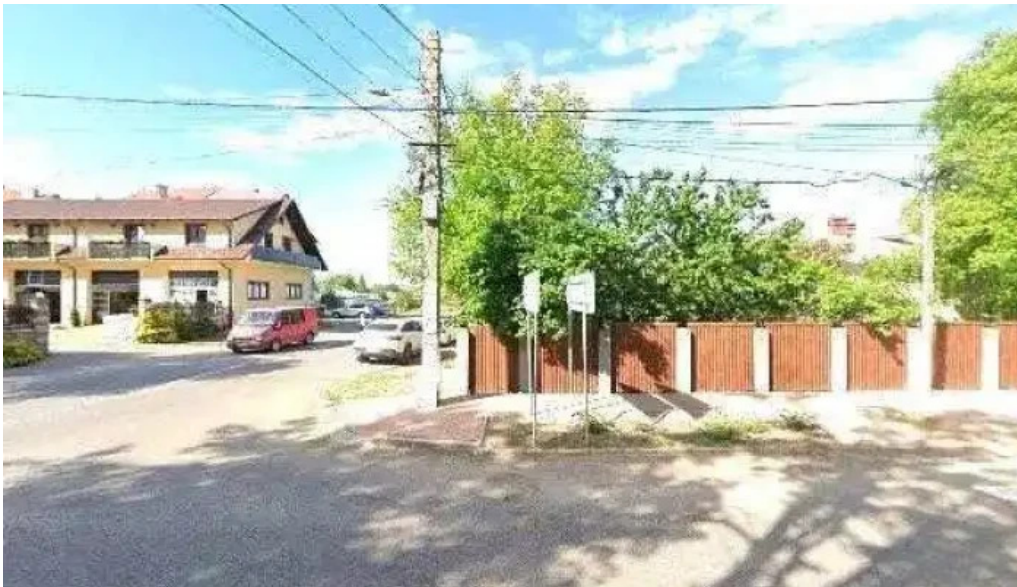
Liceul tehnologic bucecea street view si 360deg